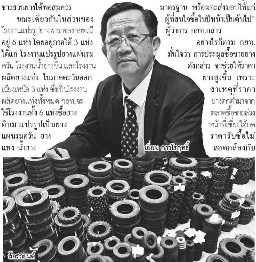
เขียม ดตารัตถ์

อย่างไรก็ตาม กยท. มันใจว่า การประมูลซื้อขายยางดังกล่าว จะช่วยให้ราคายางสูงขึ้น เพราะสาเหตุที่ราคายางตกต่ำมาจากตลาดซื้อขายล่วงหน้าที่ยังอิงราคาซื้อขายไม่สอดคล้องกับ