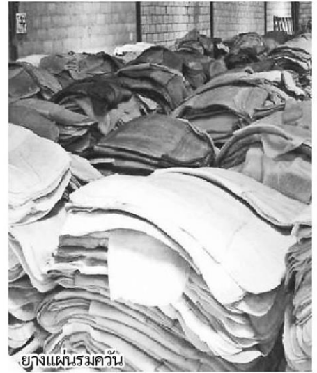
ยางแผ่นรมควัน

ขณะเดียวกันในส่วนของโรงงานแปรรูปยางพาราของ กยท. มีอยู่ 6 แห่ง โดยอยู่ภาคใต้ 3 แห่ง ได้แก่ โรงงานแปรรูปยางแผ่นรมควัน โรงงานน้ำยางข้น และโรงงานผลิตยางแท่ง ในภาคตะวันออก เชียงเหนือ 3 แห่ง ซึ่งเป็นโรงงานผลิตยางแท่งทั้งหมด กยท. จะใช้โรงงานทั้ง 6 แห่งซื้อยางดิบมาแปรรูปเป็นยางแผ่นรมควัน ยางแท่ง น้ำยาง