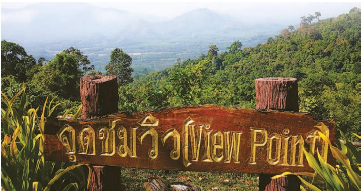
จุดชมวิวกวใกล้ลานกางเต็นท์

นำแปลกใจตรงที่ ที่ภูหินร่องกล้า ซึ่งเป็นแหล่ง ผกค.ใหญ่ของภาคเหนือ ตอนล่าง ก็ถูกปราบจนราบคาบในเวลา ใกล้เคียงกัน และเพราะป่าของอุทยาน ได้ร่มเย็นเป็นแบบนี้ มีหรือที่ความงาม ของธรรมชาติทั้งหลายจะไม่มี ผมแนะนำแบบนี้ครับ ถ้าจะมาเที่ยว