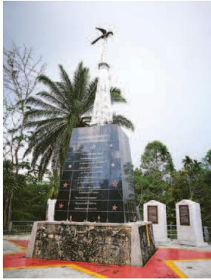
อนุสาวรีย์ช้างของเหล่าสาย

อาจจะเป็นเพราะอยู่กรุงเทพฯมาตั้ง แต่รุ่นๆ จนใกล้เกษียณ เราก็เห็นแต่ถนน หนทาง ตึกกรมบ้านช่อง พอมาเห็นชุมชน ที่ตึกแถวสูงไม่เกิน 3 ชั้น มีทุ่งนาอยู่ใกล้ๆ ภูเขาหินปูนรูปทรงสวยงาม และแม่น้ำที่ไหล มาจากป่าที่ไหลเอื่อยในหน้าแล้ง ฟุตบาท ริมแม่น้ำที่ทางเทศบาลมาทำเป็นทางวิ่ง เห็นแล้วคนเมืองอย่างเราก็ตัดใจ ไม่ใช่คน ประเภทโลกสวย แต่โลกมันสวยจริงๆ แล้ว เราไปเห็น