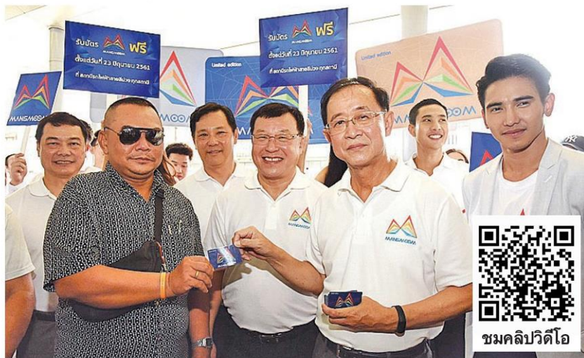
ดีเดย์ 'แมงมุม' - นายอาคม เติมพิทยาไพสิฐ รวบรวมกระทรวงคมนาคม เปิดตัวบัตรโดยสารร่วม หรือ 'บัตรแมงมุม' เชื่อมโยงระบบขนส่งสาธารณะ โดยตั้งแต่วันที่ 23 มิถุนายน สามารถใช้ได้กับรถไฟฟ้าสายสีม่วง รถไฟฟ้าใต้ดินเอ็มอาร์ที และในเดือนตุลาคมจะขยายถึงรถไฟฟ้าแอร์พอร์ตเรลลิงก์ และรถเมล์ ขสมก. ที่สถานีรถไฟฟ้าเตาปูน กทม. เมื่อวันที่ 22 มิถุนายน

ด้านนายเกรียงไกร เอี๋ยรณกุล รองประธาน ส.อ.ท. กล่าวว่า ขณะนี้ ส.อ.ท.อยู่ระหว่างสอบถามไปยังสมาชิกถึงผลกระทบจากสงครามการค้าของ 2 ประเทศสำคัญ โดยเฉพาะสินค้ากว่า 1,000 รายการที่สหรัฐเก็บเพิ่มจากจีนนั้น ไทยจะได้ผลบวกหรือลบ