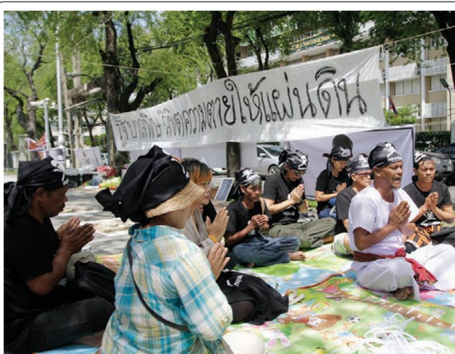
กลุ่มคัดค้าน "พาราควอต" ทำพิธีสวดคาถา บัดเป่าไล่วิญญาณภูตผี และทำการแขวนคอหลอก เพื่อเรียกร้องให้รัฐบาลยกเลิกการใช้สารเคมีในการกำจัดวัชพืชและแมลงที่เป็นอันตราย ที่หน้ากระทรวงเกษตรและสหกรณ์ เมื่อวานนี้ (14 มิ.ย.)

ภาพข่าว: กลุ่มคัดค้าน "พาราควอต" ทำพิธีสวดคาถา