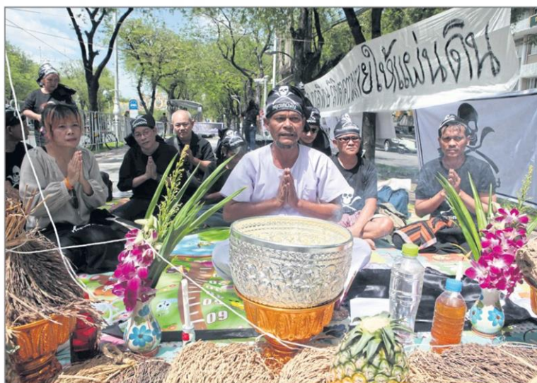
แบบสารพิษ : เครือข่ายคนอินทรีย์วิถีเมืองลุงและภาคี ทำพิธีบูชาแม่โพสพ แม่พระธรณี แม่คงคา และสิ่งศักดิ์สิทธิ์ เพื่อขอให้รัฐบาลออกกฎหมายไม่ให้มีการใช้สารเคมี 3 ชนิด คือ พาราควอด คลอร์ไพริฟอส ไกลโฟเซต และเรียกร้องให้รัฐบาลมีนโยบายส่งเสริมเกษตรอินทรีย์ อย่างเป็นทางการวงเกษตรและสหกรณ์ เมื่อวันที่ 14 มิ.ย.