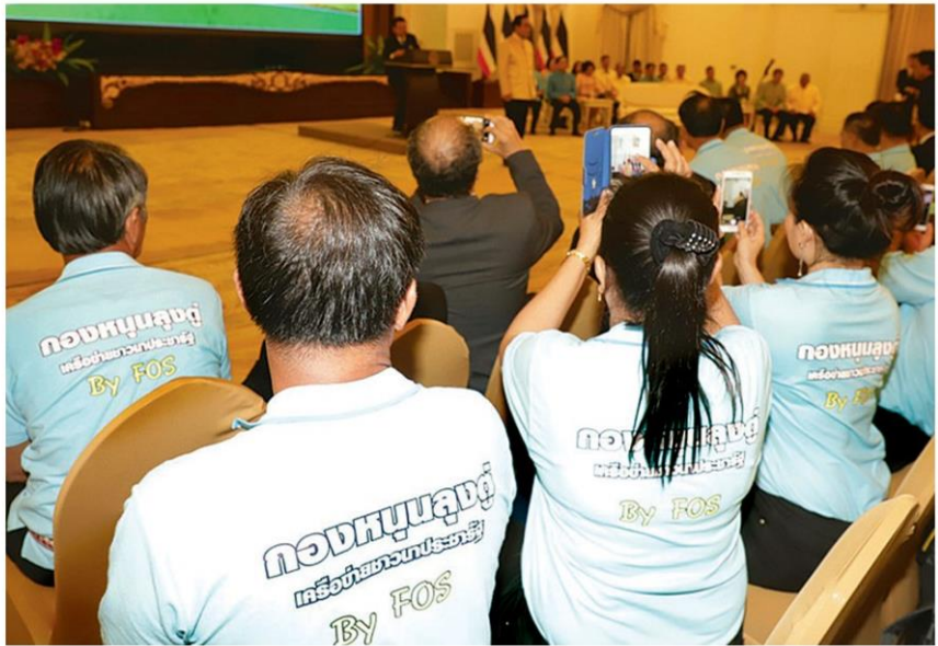
กองหนุน - ชาวนาที่ได้รับรางวัลเกษตรกรและสถาบันเกษตรกรดีเด่นด้านข้าว ประจำปี 2561 สวมเสื้อ 'กองหนุนลุงตู่' เข้าฟังนโยบายเรื่องข้าวจากพล.อ.ประยุทธ์ จันทร์โอชา นายกรัฐมนตรี ที่ทำเนียบรัฐบาล เมื่อวันที่ 8 มิ.ย.

พล.อ.ประยุทธ์กล่าวว่า สังคมวันนี้หลายอย่างมีปัญหา โดยเฉพาะสังคมโซเชียลมีเดียที่ดำเนินไปมาทุกวัน คนไม่เห็นว่าจะได้สาระอะไร ทำให้สิ่งที่ดี ล้มไปหมด ซึ่งเกิดจาก 2 อย่าง คือการเมืองและความเฟลิดเฟลิดในการเล่นโซเชียลมีเดีย โดยไม่รับผิดชอบอะไรทั้งสิ้น ดังนั้น ขอย้ำให้การเมืองนำ แต่ต้องใช้