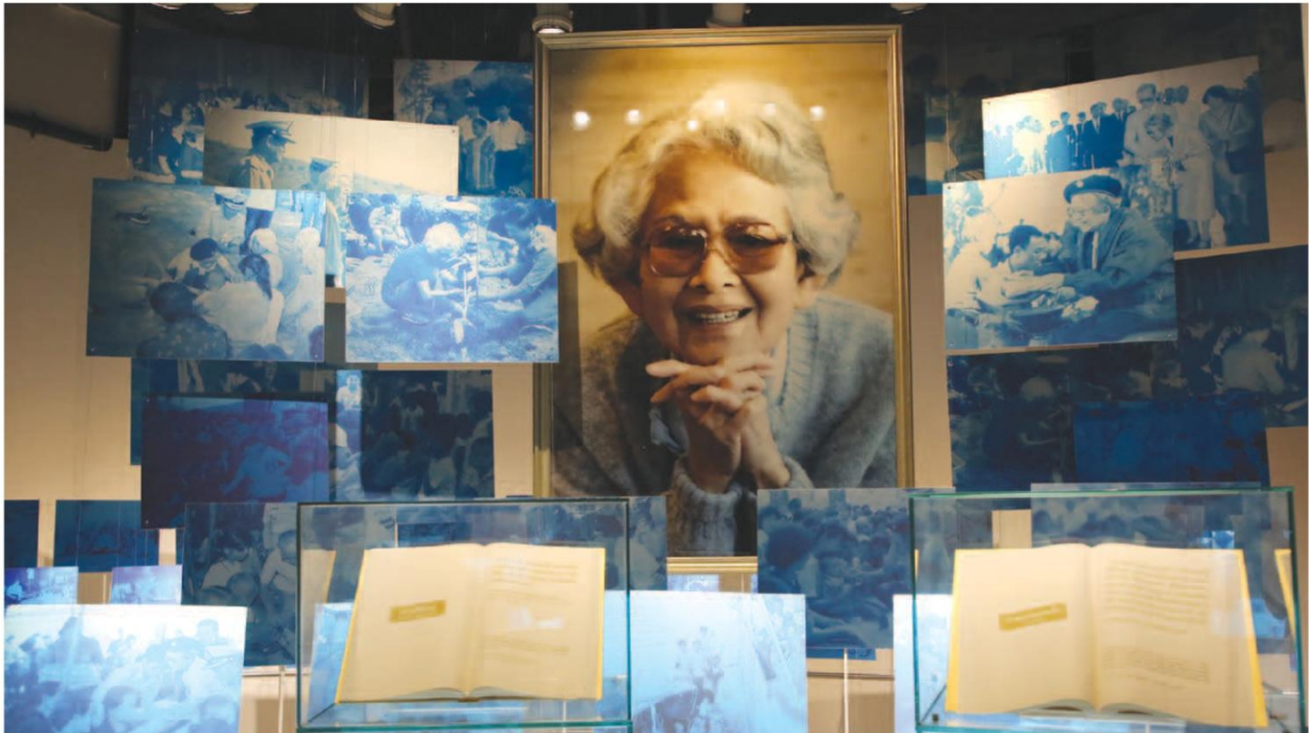
พระบรมฉายาลักษณ์สมเด็จพระศรีนครินทราบรมราชชนนี ภายใน 'หอแห่งแรงบันดาลใจ'