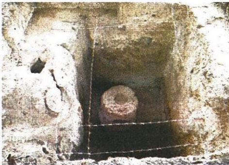
แหล่งโบราณคดีเมืองดงละคร