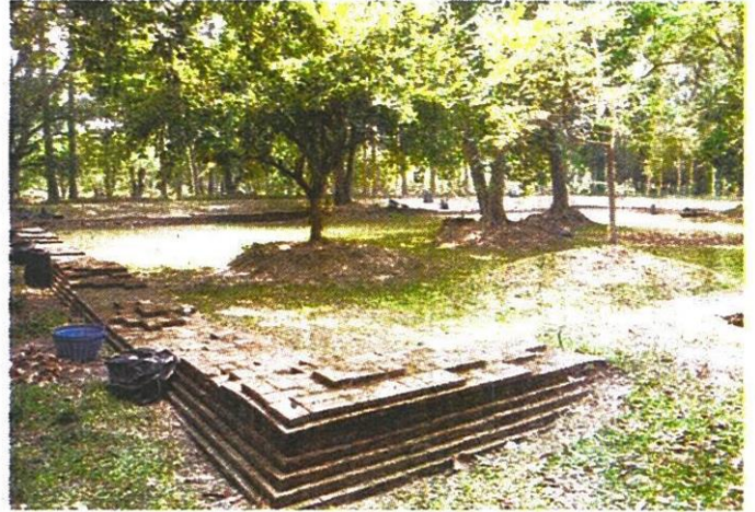
โบราณสถาน