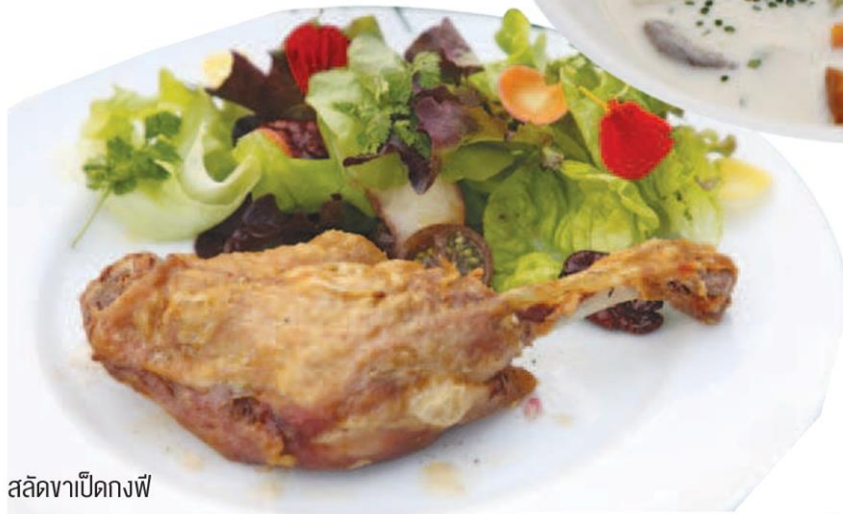
สลัดขาเป็ดงพี

“คนจะติดยาเสพติด หรือค้ายาเสพติด มีพื้นฐาน