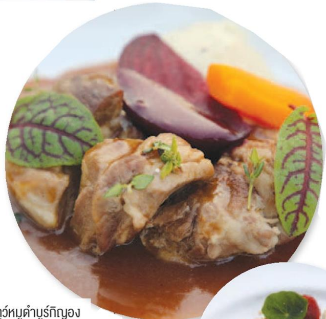
สตุว์หมูดำบูร์กญอง

ประเทศ, ปลูกป่ายังชีพ คือป่าไผ่ และกล้วย เพื่อไม่ต้องไปตัดไม้ทำลายป่า และ ปลูกป่าเศรษฐกิจ