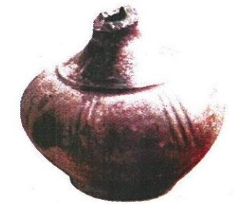
ภาชนะศิลปะขอม

เชื่อว่า เวลากลางคืน ได้ยินเสียงดนตรีมโหรีแว่วออกมาจากในป่ากลางเมืองราวกับมีงานละคร จึงเรียกว่า ดงละคร นัยว่าเมืองที่มีการเล่นละครในดง บ้างกว่าเมืองนี้ น่าจะเรียกว่าดงนคร หมายถึงนครที่อยู่ในดง แล้วเพี้ยนเปลี่ยนเป็นดงละคร