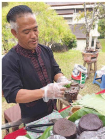
ข้าวปักปิ้ง

ดอยดุงลอร์ดจ(ที่พัก) และพระตำหนักดอยดุง “กิจกรรม Tops Exclusive Trip ปีนี้เป็นปีแรกที่ท็อปส์ฟาลูกค้าคนสำคัญ ร่วมเปิดประสบการณ์อันน่าประทับใจที่โครงการ