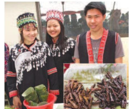
ชาวไทยภูเขาเผ่าอาข่าผู้ทำหมูทอดห่อใบชา-ใบกาแฟ