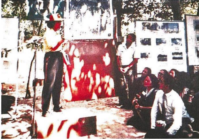
สมเด็จพระเทพรัตนราชสุดาฯ สยามบรมราชกุมารี เสด็จฯ เมืองดงละคร