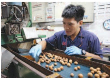
ชมขั้นตอนการคัดแยกขนาดผลแมคคาเดเมียภายในพื้นที่ทำงานบริษัทงิ้วดอย ไซต์ 1