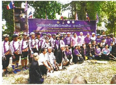
ผู้ร่วมกิจกรรมวันอนุรักษ์