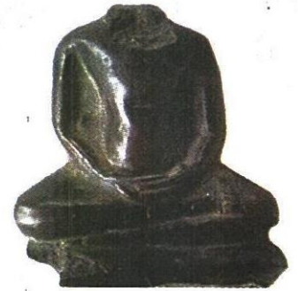
องค์พระพุทธรูปศิลา