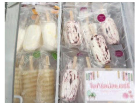
ไอศกรีมดอยตุงใช้วัตถุดิบโครงการพัฒนาดอยตุงฯ และในแพคเกจกาแฟเนื้อ บรรจุในพลาสติกแบบย่อยสลายง่าย

นอกจากนี้ยังมี กล้วยหอมทอด กล้วยแขกทอด มันทอด จากซุ้ม ‘เป็นทอดๆ’ และ ไอศกรีมดอยตุง (Doi Tung Popsicle) ที่ใช้วัตถุดิบจากโครงการพัฒนา ดอยตุงฯ และในพื้นที่ เพื่อต่อยอดธุรกิจ และสร้างรายได้ให้ชาวบ้าน เช่น รสชามะนาว น้ำผึ้ง ทำจากชาออร์แกนิกของสหกรณ์