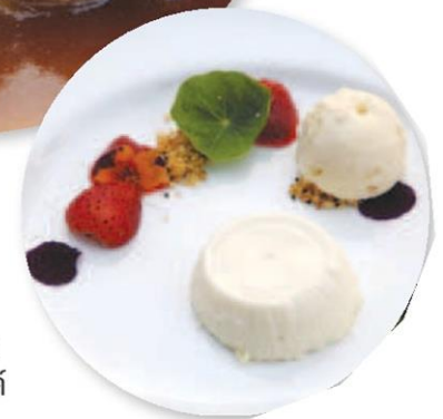
เบลอมองจ แมอิลมอนด์

รหัสข่าว: C-180408011068 (8 เม.ย. 61/07:23)