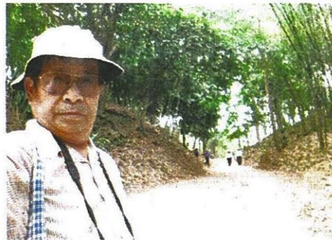
แนวคันดินและประตูเมือง