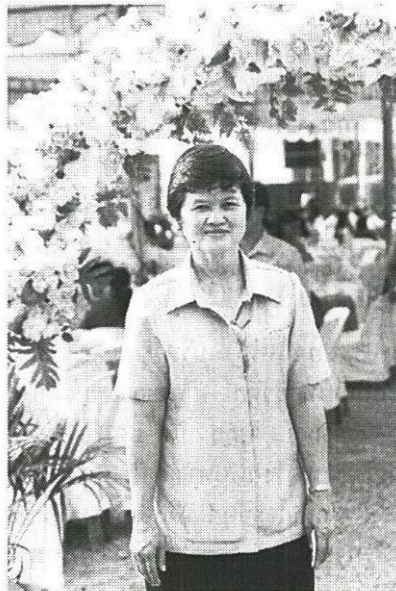
ให้กับนักเรียนในจังหวัดสุพรรณบุรี และร่วมกับสหกรณ์จัดโครงการออมทรัพย์