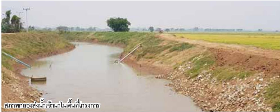
สภาพคลองส่งน้ำเข้ามาในพื้นที่โครงการ

หัวข้อข่าว: ขยายผล 'บางระกำโมเดล' ปี 61 ปรับปฏิทินนาปี-เพิ่มพื้นที่ปลูกข้าว