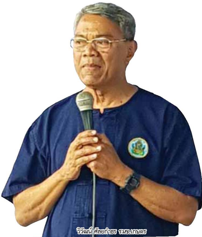
วิวัฒน์ ศัลยกำธร รัฐมนตรีเกษตร