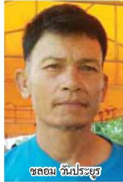
ชalom วันประยูร