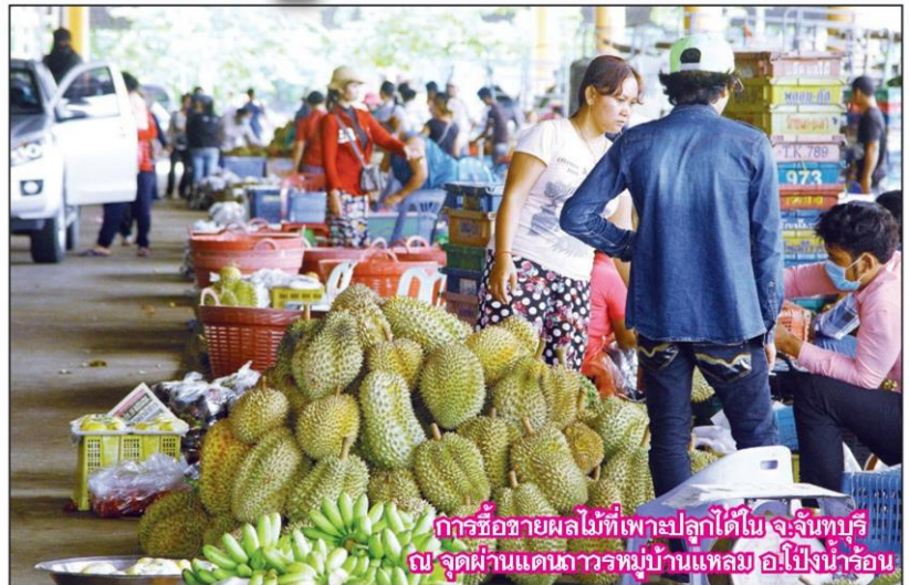
การซื้อขายผลไม้ที่เพิ่งปลูกได้ไม่ จ.จันทบุรี ณ จุดผ่านแดนถาวรหมู่บ้านแหลม อ.โป่งน้ำร้อน