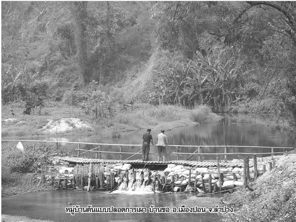
หมู่บ้านต้นแบบปลอดภัย บ้านขอ อ.เมืองปาน จ.ลำปาง

จังหวัดลำปางมี 13 อำเภอ อ.เมืองปาน เป็นอำเภอเดียวที่แทบไม่พบจุดความร้อน มีการไหม้ แต่จัดการได้ดี ดับไฟป่าทันที แต่ชาวบ้านยังได้รับผลกระทบจากมลพิษทางอากาศจากอำเภออื่น