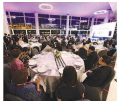
บรรยากาศภายในงาน

“เมืองไทยไม่ได้ขาดเงินทุน แต่ต้องมีการเชื่อมต่อให้ประชาชนเข้าถึงแหล่งเงินทุนได้ง่ายขึ้น”