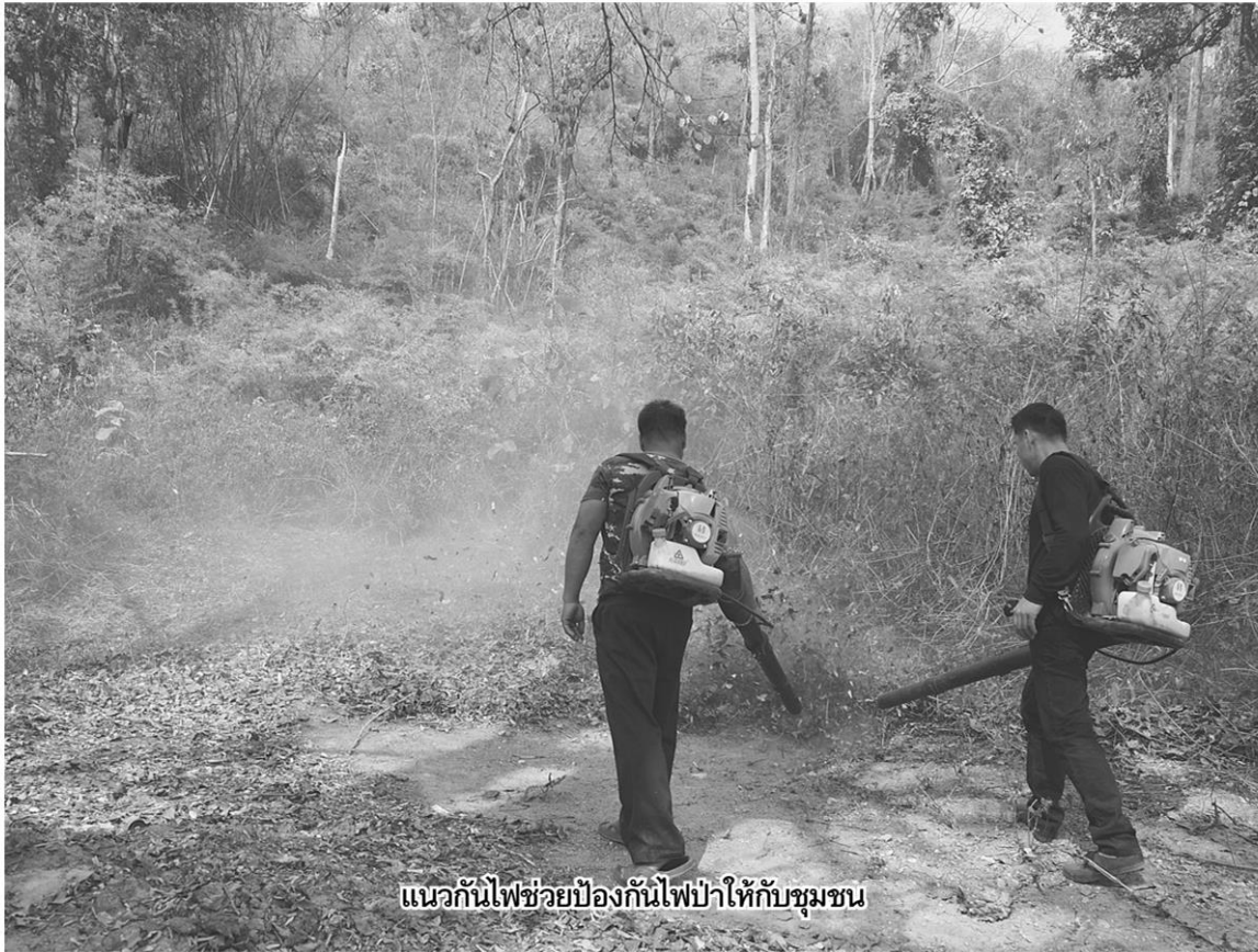
แนวกันไฟช่วยป้องกันไฟป่าให้กับชุมชน