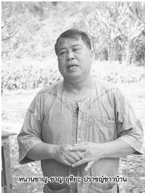
หนานชาญ-ชาญ อุทัยะ ประชาชนบ้าน

สถานการณ์หมอกควันรุนแรง กระทบสุขภาพ สิ่งแวดล้อม การเกษตร เศรษฐกิจ ท่องเที่ยว จะเดินหน้าแก้อย่างไร บ้านขอวันนี้อย่างไร แต่หมู่บ้านอื่นๆ ยังเผา ปัญหาหมอกควันภาพรวมแก้อย่างไร ธรรมชาติในพื้นที่ต้นแบบจะขยายสู่พื้นที่อื่น ขยายความคิด ให้ภาพฝัน และช่วยทำให้สำเร็จ