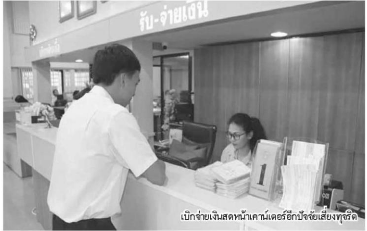
เบิกจ่ายเงินสดหน้าเคาน์เตอร์อีกปัจจัยเสี่ยงทุจริต

“ทุกวันนี้ฝากตั้งค์หรือปล่อยกู้แต่ มองหน้ากัน แต่แต่งตัวคิดว่าเชื่อถือเอาไปเลย 20 ล้าน ทั้งที่ฐานะเป็นอย่างไรไม่เคยไปดูเลย แต่วันหนึ่งมันไม่ใช่ อย่างวันที่เงินสหกรณ์สโมสรรถไฟไซ้อต เอามาช่วยหน้อย 700 ล้าน ก็ต้มฟไปเลย 700 ล้าน แล้วรถไฟเอาเงินไปไหนก็ไม่รู้ อำนาจอนุมัติของกรรมการสหกรณ์ก็ไม่มีการทวนไว้ จะอนุมัติเท่าไรก็ได้เหมือนกันทุกสหกรณ์ เราก็มักออกเกณฑ์ไปว่าการอนุมัติจะต้องไม่เกิน 10 เปอร์เซ็นต์ของสินทรัพย์ที่คุณจะเอาไป และไม่เกิน 10 เปอร์เซ็นต์ของ