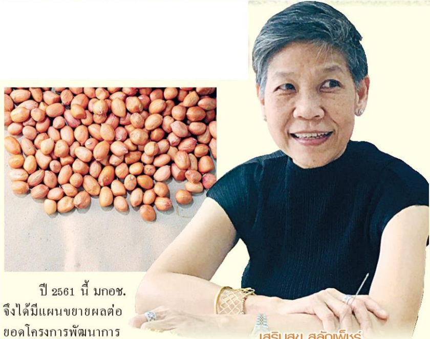
เสริมสุข สลักเพชร

ปี 2561 นี้ มกอช. จึงได้มีแผนขยายผลต่อ ยอดโครงการพัฒนาการ ปลูกถั่วลิสงหลังนาข้าวตาม มาตรฐาน GAP ในพื้นที่นาข้าวแปลงใหญ่ จังหวัดอุบลราชธานี ตามนโยบายของกระทรวง เกษตรและสหกรณ์ ที่มุ่งส่งเสริมการปลูกพืช อายุสั้นใช้น้ำน้อยหลังการทำนา เพื่อทดแทน และลดการทำนาปรังโดยเฉพาะพื้นที่ที่มีน้ำ ต้นทุนจำกัด และสร้างรายได้เสริมให้กับ เกษตรกรหลังเก็บเกี่ยวข้าว ทั้งยังเป็นการใช้ ที่ดินให้เกิดประโยชน์และมีประสิทธิภาพสูงสุด และลดการทิ้งถิ่นฐานอพยพเข้ามาใช้แรงงาน เมืองใหญ่ในช่วงฤดูแล้ง