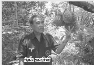
คำนิ้ง ชนะสิทธิ์

“ทำใจได้เลยว่าปีนี้ผลไม้แพงแน่นอน ไม่ว่าจะทุเรียน เงาะ มังคุดหรือลองกอง เพราะที่ฝนไม่เป็นใจ สภาพภูมิอากาศที่เปลี่ยนไป อย่างช่วงเดือนธันวาคมทุเรียนกำลังออกดอก ฝนเท