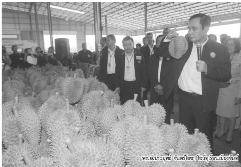
พล.อ.ประยุทธ์ จันทร์โอชา ไร่ทุเรียนเมืองจันทน์

หนึ่งในวาระสำคัญของการประชุมคณะรัฐมนตรีนอกสถานที่(กรม.สัตยจร) ที่ จ.จันทบุรี ในวันที่(6 ก.พ.) คือการลงนามบันทึกข้อตกลงความร่วมมือด้านมาตรฐานคุณภาพผลไม้ไทยระหว่างกระทรวงพาณิชย์ หอการค้าไทย มหาวิทยาลัยเชียงใหม่ และมหาวิทยาลัยบูรพา และบันทึกข้อตกลงการเชื่อมโยงตลาดผลไม้แหล่งผลิต และตลาดรองรับสำคัญ ระหว่างหอการค้าจังหวัดต่างๆ กับหอการค้านำเข้าผลไม้ของจีนและหอการค้าจังหวัดไพลิน ของกัมพูชา โดยรัฐบาลนำวัดหวังโพธิ์จันทบุรี เป็นมหานครแห่งผลไม้เมืองร้อนหรือ "ฮับ" ผลไม้โลก