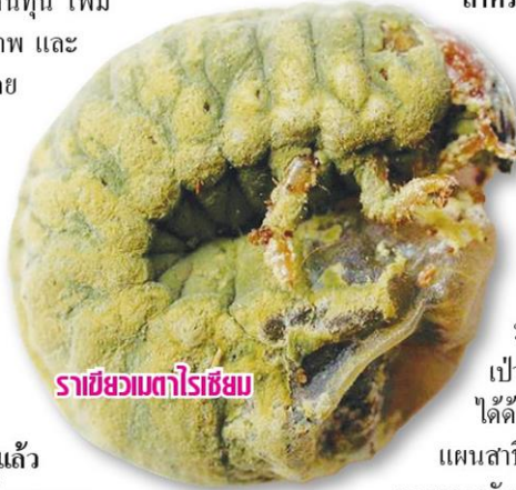
ราเชียวเมตาโรเชียม

วิจัยและพัฒนาเทคโนโลยีเพิ่มประสิทธิภาพการผลิตพืชปลอดภัยโดยใช้เทคโนโลยีเกษตรอัจฉริยะ กรมวิชาการเกษตรเร่งรัดวิจัยและพัฒนาเพื่อให้ได้เทคโนโลยีการผลิตพืชปลอดภัย ลดต้นทุน เพิ่ม