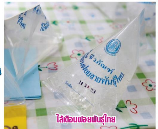
ไว้ก่อนพอยพันธุ์ไทย

กำกับดูแลร้านค้าปัจจัยการผลิตทางการเกษตร กรมวิชาการเกษตร มีแผนการตรวจร้านค้าปัจจัยการผลิตทางการเกษตรเป็น 100% และปรับปรุงขั้นตอนโดยลดระยะเวลาดำเนินการและจัดทำเป็นแนวทางการปฏิบัติงาน