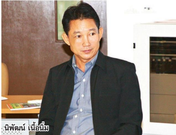
นิพนธ์ เนื่อนิม

หัวข้อข่าว: มองสถานการณ์หมูให้ลึก กำลังซื้อกลุ่มรายได้ปานกลาง-รายได้น้อย ถดถอย...ทราคาดตก