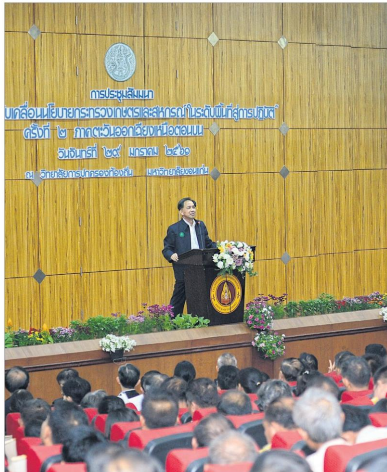
ขับเคลื่อนเกษตร : กฤษฎา บุญราช รัฐมนตรีว่าการกระทรวงเกษตรและสหกรณ์ พร้อมด้วยผู้บริหารกระทรวงเกษตรและสหกรณ์ ลงพื้นที่ร่วมประชุมสัมมนา "การขับเคลื่อนนโยบายกระทรวงเกษตรและสหกรณ์ในระดับพื้นที่สู่การปฏิบัติ" ครั้งที่ 2 ภาคตะวันออกเฉียงเหนือตอนบน ณ วิทยาลัยการปกครองท้องถิ่น มหาวิทยาลัยขอนแก่น จ.ขอนแก่น