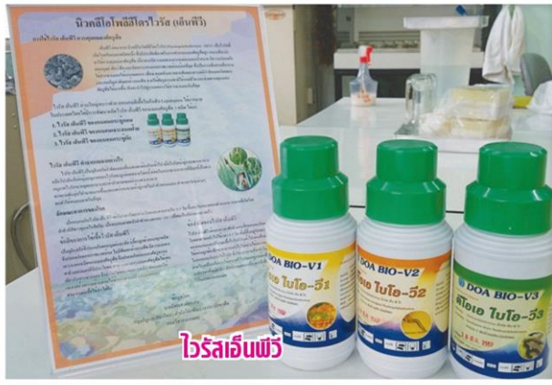
ไวรัสอินทรีย์

ไปขยายผลเชิงพาณิชย์ ปัจจุบันอยู่ระหว่างการวิจัยพัฒนาบรรจุภัณฑ์ ไล่เดือนฝอยให้เกษตรกรขนส่ง และ สร้างโมเดลโรงงานผลิตชีวภัณฑ์โดยนำร่องในไล่เดือนฝอยสายพันธุ์ไทย