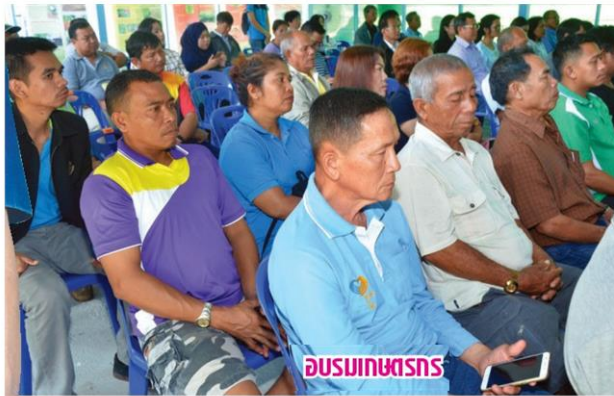
อบรมเกษตรกร

นอกจากนโยบายการปฏิบัติงานดังกล่าวแล้ว กรมวิชาการเกษตรยังมีผลงานวิจัยด้านชีวภัณฑ์เพื่อลดการใช้สารเคมีซึ่งได้มีการถ่ายทอดองค์ความรู้และเทคโนโลยีไปสู่เกษตรกรและผู้ที่เกี่ยวข้องแล้ว ดังนี้ ชีวภัณฑ์ไล่เดือนฝอยสายพันธุ์ไทย เป็นชีวภัณฑ์ที่มีประสิทธิภาพในการกำจัดศัตรูผักได้หลายชนิด สามารถนำไปใช้ทดแทนสารฆ่าแมลงได้ด้วยเทคโนโลยีการผลิตแบบง่าย ต้นทุนต่ำ ทำให้เกษตรกรสามารถเพาะขยายได้เอง ปัจจุบันเกษตรกรผลิตใช้เองแล้วจำนวน 158 ราย โดยกระจายในกลุ่มเกษตรกรเครือข่าย 376 ราย (รวม 534 ราย) และผู้ประกอบการนำ