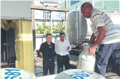
กรมส่งเสริมสหกรณ์... >8 พัฒนายกระดับสหกรณ์โคนม