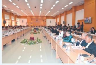
ภาพลึกลับเดินหน้า > 6 โมเดลแก๊งงั้น ต้นแบบประเทศไทย