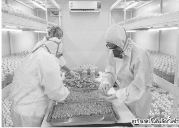
ธุรกิจเอสเอ็มอีผลิตกุ้งแช่