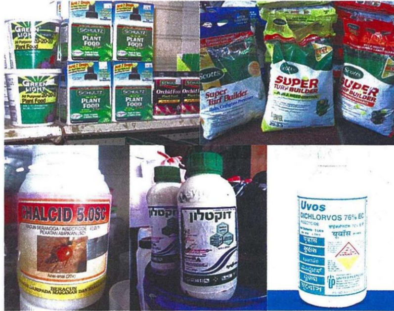
"สารเคมีเกษตร" มีการใช้กันทั่วโลก

ข้อมูลจากเว็บไซต์สำนักงานเศรษฐกิจการเกษตร กระทรวงเกษตรและสหกรณ์ (www.oae.go.th) ระบุว่า ในปี 2559 ประเทศไทยนำเข้าปุ๋ยเคมีทั้งสิ้น 885,419 ตัน มูลค่า 12,654 ล้านบาท และนำเข้าสารกำจัดศัตรูพืชทั้งสิ้น 160,824 ตัน มูลค่า 20,618 ล้านบาท