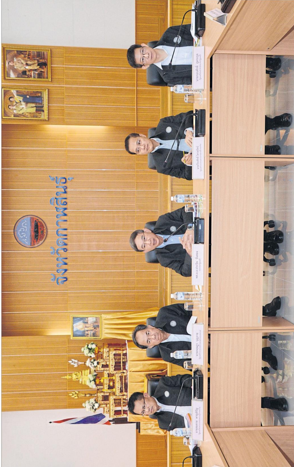
กาฬสินธุ์โมเดล : ภาณุราช บุญราช ร่มเกล้าและสหกรณ์ (ที่ 2 จากซ้าย) ร่วมประชุมกับ พล.อ.อ.ประจักษ์ คุ้มทอง รองนายกรัฐมนตรี (กลาง) เรื่องการขับเคลื่อนกาฬสินธุ์โมเดล เพื่อยกระดับรายได้ให้แก่ประชาชนเห็นความก้าวหน้า ตามข้อสั่งการของนายกรัฐมนตรีนายกรัฐมนตรี ร่วมกับหน่วยงานที่เกี่ยวข้อง เช่น กระทรวงอุตสาหกรรม กระทรวงพาณิชย์ กระทรวงมหาดไทย เน ศาลากลาง จังหวัดกาฬสินธุ์