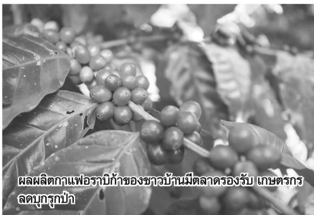
ผลผลิตกาแฟอร่ามทั้งของชาวบ้านมีตลาดรองรับ เกษตรกรลดบุงกูป่า