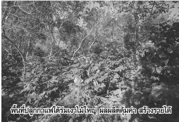
พื้นที่ปลูกกาแฟได้เริ่มเงาไม้ใหญ่ ผลผลิตคุ้มค่า สร้างรายได้