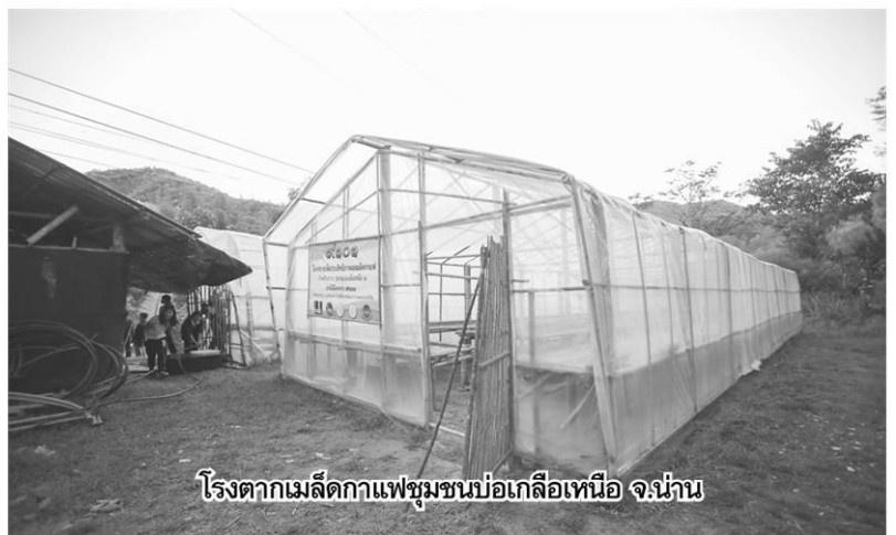
โรงตากเมล็ดกาแฟชุมชนบ่อเกลือเหนือ จ.น่าน

ร่วมกับหลายหน่วยงานจากภาครัฐ เช่น กรมป่าไม้ กรมวิชาการ เกษตร กรมพัฒนาที่ดิน กรมส่งเสริมการเกษตร และ กศน. มาให้ความรู้เรื่องการปลูกกาแฟเพื่อเป็นพืชเศรษฐกิจ ร่วมกับพืชต่างๆ ในหมู่บ้าน และซีพี รีเทลลิงค์ รับซื้อเมล็ดกาแฟที่เกษตรกรบ้านห้วยขาบผลิตได้ในราคาสูงกว่าท้องตลาด 10% ปัจจุบันมีพื้นที่ปลูกกาแฟ 1,700 ไร่ ก็ถือว่ายุติการเผาป่า 1,700 ไร่ เพราะในไร่กาแฟต้องมีสภาพแวดล้อมที่เหมาะสม ทำแนวป้องกันไฟต่อไปจะขยายโรงตากเมล็ดกาแฟเพิ่ม เพื่อลดค่าขนส่ง