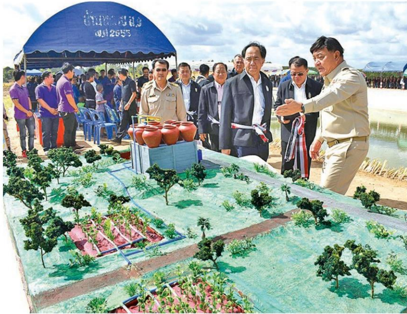
ลงพื้นที่ - นายกฤษฎา บุญราช รมว.เกษตรและสหกรณ์ ลงพื้นที่ติดตามโครงการกาฬสินธุ์แฮปปี้เน็ตโมเดล ต้นแบบแก้ปัญหาความยากจนของรัฐบาล ที่ จ.กาฬสินธุ์ เมื่อวันที่ 6 มกราคม