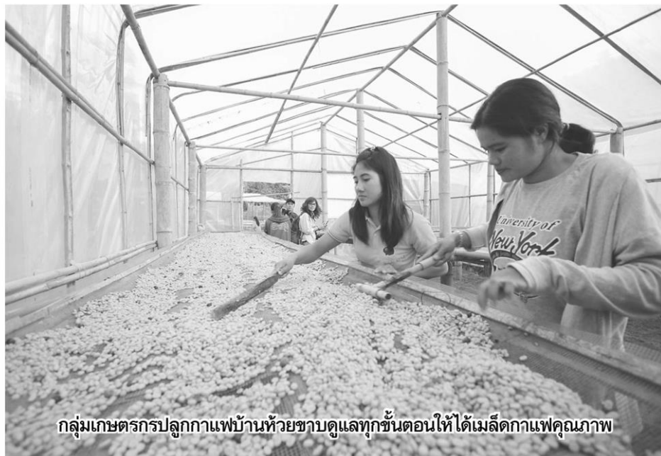
กลุ่มเกษตรกรปลูกกาแฟบ้านห้วยขาบดูแลทุกขั้นตอนให้ได้เมล็ดกาแฟคุณภาพ

ร ถขับเคลื่อนสี่ล้อชะลอความเร็ว ผุ่นที่ตลบค่อยๆ จางลง เมื่อมาถึงจุดหมาย โครงการสร้างป่า สร้างรายได้ บ้านห้วยขาบ ในพระราชดำริของสมเด็จพระเทพรัตนราชสุดาฯ สยามบรมราชกุมารี บลายทางต่อไปคือการเดินเท้าเข้าไปในป่า เพื่อให้ถึงบ้านห้วยขาบ ต.บ่อเกลือเหนือ อ.บ่อเกลือ จ.น่าน ชุมชนชาติพันธุ์ลัวะ ตั้งอยู่ใต้ร่มไม้สีเขียวกลางหุบเขา สมบูรณ์ด้วยทรัพยากรธรรมชาติ และวิถีการดำรงชีวิตที่พึ่งพิงป่าอย่างแท้จริง นอกจากการปลูกข้าวและปลูกพืชต่างๆ เลี้ยงปากท้องแล้ว ที่นี้มีการส่งเสริมความรู้เรื่องการปลูกกาแฟพันธุ์อาราบิก้า ร่วมกับปลูกพืชชนิดอื่นๆ ทำให้ชาวห้วยขาบได้พบทางสว่าง อีก