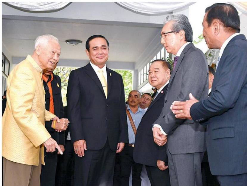
อวยพรปีใหม่ - พล.อ.ประยุทธ์ จันทร์โอชา นายกรัฐมนตรีและหัวหน้า คสช. นำผู้นำเหล่าทัพ คณะรัฐมนตรี ข้าราชการตำรวจ ทหาร เข้าอวยพรและขอรับพรปีใหม่ พล.อ.เปรม ตมสุสานนท์ ประธานองคมนตรีและรัฐบุรุษ เนื่องในโอกาสวันขึ้นปีใหม่ ณ บ้านสี่เสาเทเวศร์ เมื่อวันที่ 28 ธันวาคม

ต่อมา พล.อ.ประยุทธ์เรียกหา พล.อ.อนุพงษ์ เผ่าจินดา รมว.มหาดไทย พร้อมบอก พล.อ.เปรม ว่า “สาม ป.ผมเนี่ย หนักครับ โดนอยู่ทุกวัน เพราะคนไม่เข้าใจ และยากที่จะให้ทุกคนเข้าใจตรงกัน เป็นไปไม่ได้อยู่แล้ว สิ่งที่ผมสัญญากับป้าไว้ ผมจะทำให้ได้ จะไม่โมโห