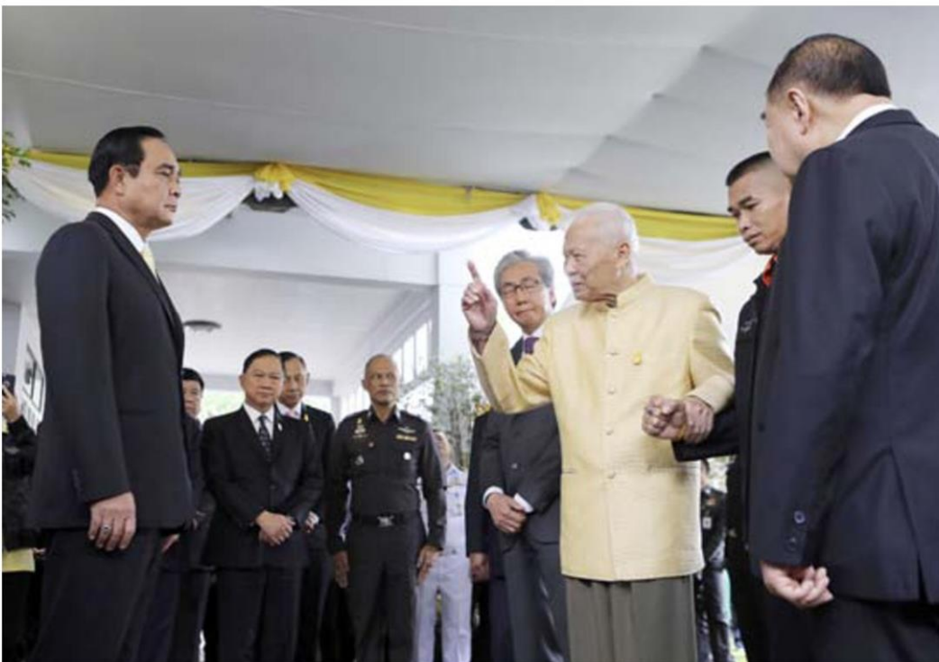
อวยพรป่า - พล.อ.เปรม ติณสูลานนท์ ประธานองคมนตรีและรัฐบุรุษ ได้เปิดบ้านสี่เสาเทเวศร์ให้ พล.อ.ประยุทธ์ จันทร์โอชา นายกรัฐมนตรี และหัวหน้า คสช. นำคณะรัฐมนตรี ผู้บัญชาการเหล่าทัพ และหัวหน้าส่วนราชการต่างๆ เข้าอวยพรเนื่องในโอกาสเทศกาลปีใหม่