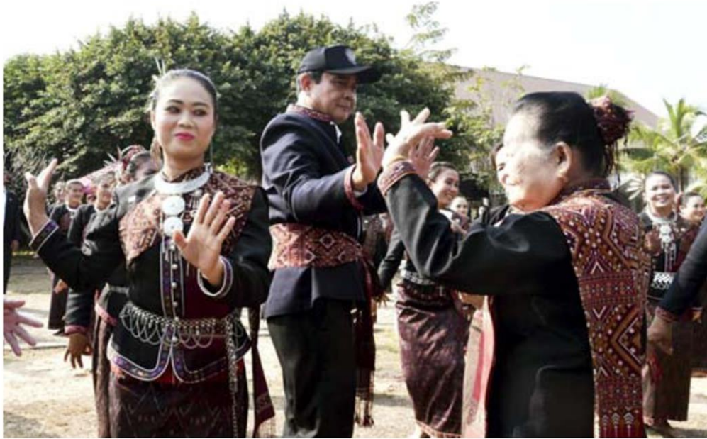
พล.อ.ประยุทธ์ จันทร์โอชา นายกรัฐมนตรี และหัวหน้า คสช. ร่วมพื่อญาติ กับชาวบ้าน โดยมีวงโปงลาง ช่วยเล่นเพลง ทำให้บรรยากาศเป็นไปอย่างคึกคัก ระหว่างนำคณะรัฐมนตรีลงพื้นที่ ติดตามนโยบายของรัฐบาล ที่จังหวัดกาฬสินธุ์ วานนี้ (13 ธ.ค.)