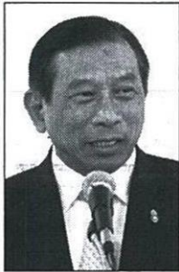
พล.อ.ฉัตรชัย สาริกัลยะ

สำหรับสินค้าที่จัดจำหน่ายในครั้งนี้ จะมีความหลากหลายและโดดเด่นจากกลุ่ม เกษตรกรทั่วประเทศ อาทิ ผลิตภัณฑ์นม จากสหกรณ์โคนมในโครงการอันเนื่องมา จากพระราชดำริ สัมโถงทิพย์สยาม GI