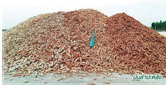
บับสำปะหลัง

โดยสินค้าที่สำคัญประกอบด้วย ยางพารา จะมีการบริหารจัดการทั้งด้านปริมาณและชีพพลาย โดยในด้านปริมาณ (ความต้องการ) มีการส่งเสริมการใช้ภายในประเทศเพื่อลดผลผลิตที่จะเข้าสู่ตลาด โดย