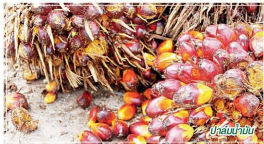
ปาล์มน้ำมัน