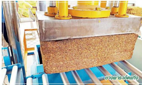
ยางพาราอัดแท่ง