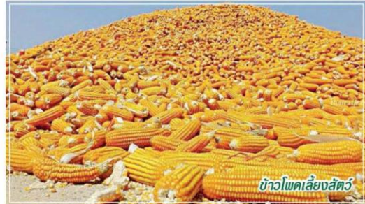
ข้าวโพดเลี้ยงสัตว์