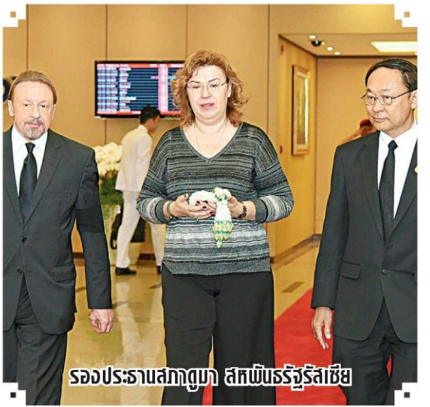
รองประธานสภาดูมา สกพันธ์รัฐรัสเซีย