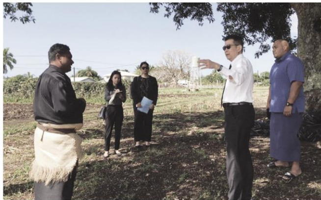
▲ ศูนย์การศึกษาและการเรียนรู้ปรัชญาเศรษฐกิจพอเพียงที่ราชอาณาจักรคองกา ซึ่งได้รับความช่วยเหลือจากวิชาการจากรัฐบาลไทย (ภาพจากกระทรวงการต่างประเทศ)

โครงการฝนเทียมเกิดจากพระราชดำริส่วนพระองค์ของในหลวง รัชกาลที่ 9 ที่เสด็จเยี่ยมพสกนิกรในภาคตะวันออกเฉียงเหนือในปี พ.ศ. 2498 ทำให้ได้ทรงรับทราบถึงความเดือดร้อนของราษฎรและเกษตรกรที่ขาดแคลนน้ำเพื่อการอุปโภคบริโภค