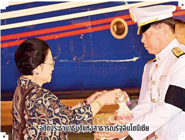
อดีตประธานาธิบดีแห่งสาธารณรัฐอินโดนีเซีย