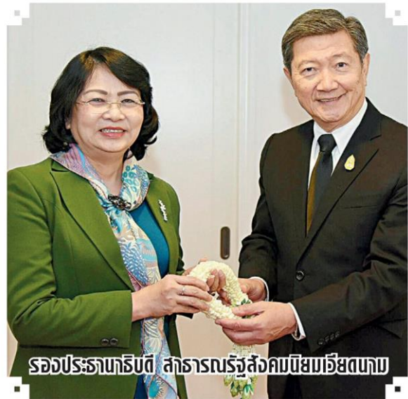
รองประธานาธิบดี สาธารณรัฐสังคมนิยมเวียดนาม