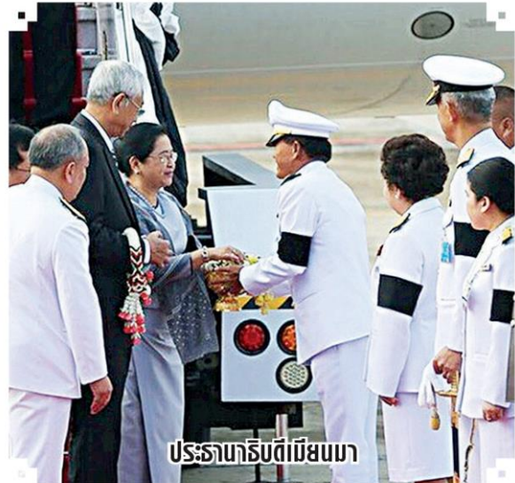
ประธานาธิบดีเมียนมา

รหัสข่าว: C-17102600409 (26 ต.ค. 60/06:25)