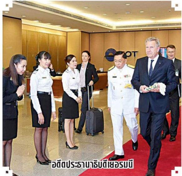
อดีตประธานาธิบดีเยอรมนี