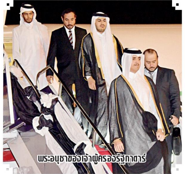
พระอนุชาของเจ้าผู้ครองรัฐกาตาร์