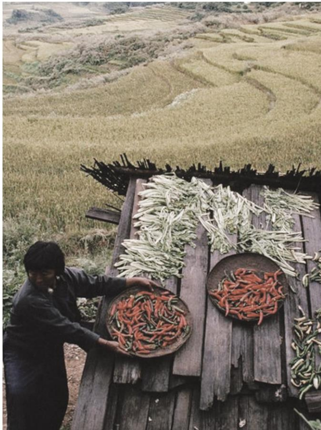
△ การทำการเกษตรตามแนวปรัชญาเศรษฐกิจพอเพียงที่ภูฏาน

บัตรฝนหลวงถ่ายทอดวิทยากร ทำฝนเทียมให้กับอีก 3 ประเทศ ได้แก่ ออสเตรเลีย แคนซันเนีย และโอมาน