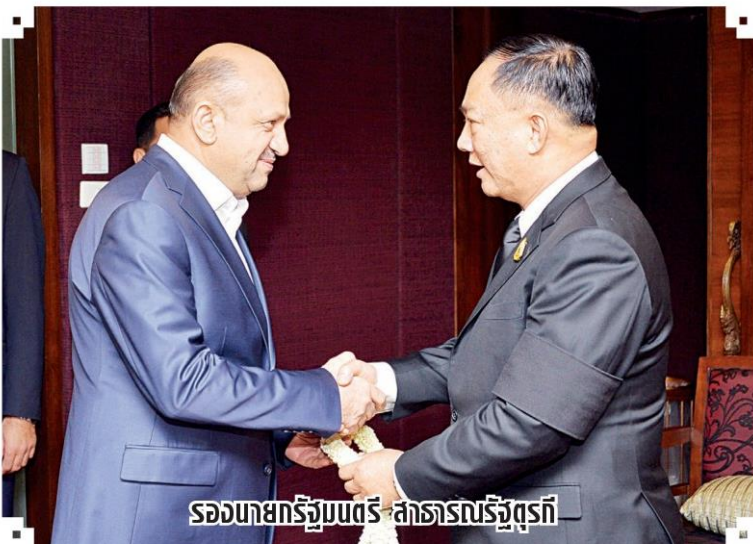
รองนายกรัฐมนตรี-สาธารณรัฐตุรกี