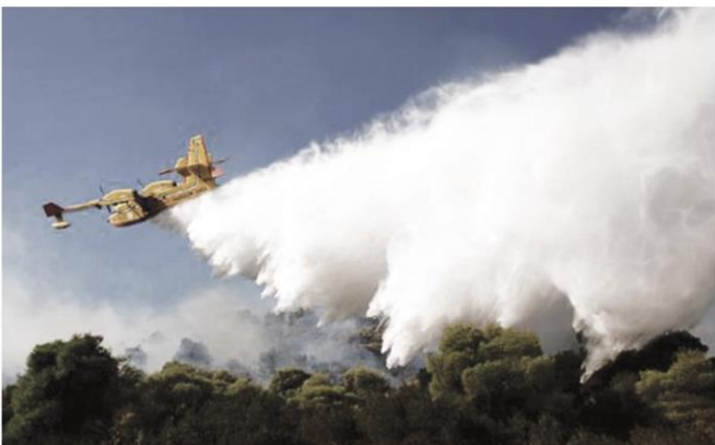
▲ จอร์แดน ได้ขอพระบรมราชานุญาตนำเทคนิคการทำฝนหลวงไปใช้ตั้งแต่ปี 2552

และการเกษตร ด้วยพระมหากรุณาธิคุณต้องการบรรเทาความทุกข์ร้อนของพสกนิกร จึงได้พระราชทานโครงการพระราชดำริฝนหลวง ให้กับม.ร.ว.เทพฤทธิ์