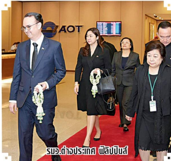
รมว.ต่างประเทศ ฟิลิปปินส์