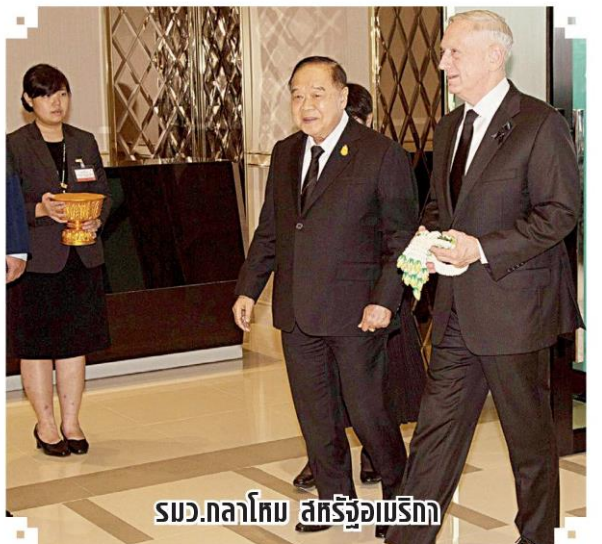
รมว.กลาโหม สหรัฐอเมริกา