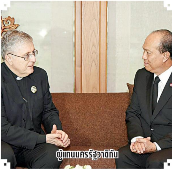
ผู้แทนนครรัฐวาติกัน

หัวข้อข่าว: สื่อทั่วโลกยกย่องพลกนิกร ปักหลักร่วมพระราชพิธีร.9 'กษัตริย์จักรี'เสด็จถึงไทย