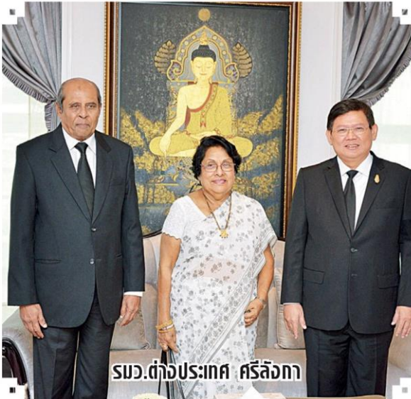
รมว.ต่างประเทศ ศรีลังกา