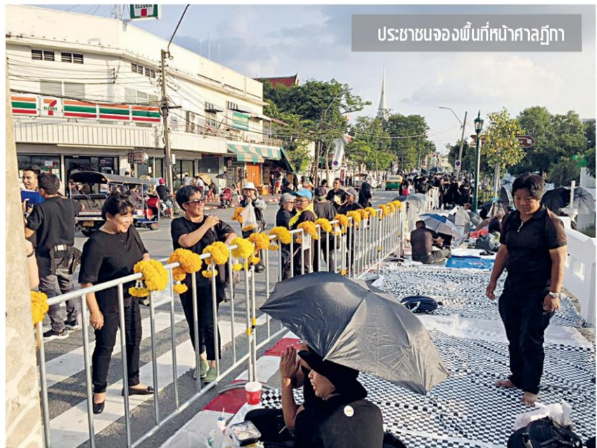
ประชาชนจองพื้นที่หน้าศาลฎีกา