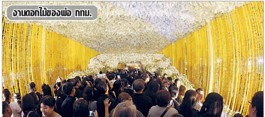
งานดอกไม้ของพ่อ ททท.