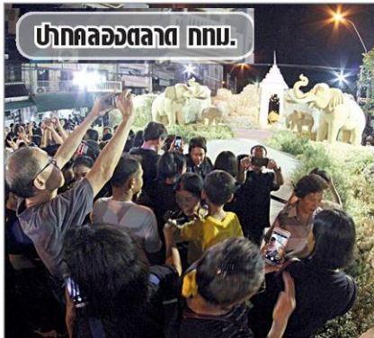
ปากคลองตลาด ททท.