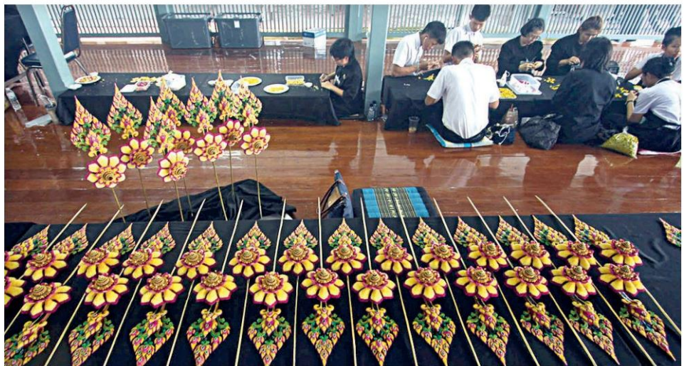
▲ ประดิษฐ์ถวาย...กลุ่มช่างศิลปกรรม ช่างราชสำนัก และจิตอาสา เร่งประดิษฐ์ดอกปาริชาติประดับพระจิตกาธาน อาทิ ดอกไหว ดอกเฟื่อง ดอกเอว ขณะนี้เสร็จแล้วกว่าร้อยละ 80 พร้อมนำไปติดตั้งที่พระเมรุมาศ

○ ยังไม่กำหนดปิดถวายดอกไม้ เมื่อวันที่ 23 ต.ค. ที่ถนนหน้าพระลาน หน้าพระบรมมหาราชวังสมเด็จพระเจ้าอยู่หัวทรงพระกรุณาโปรดเกล้าฯพระราชทานพระราชานุญาตให้สำนักพระราชวังจัดทำขุ่มประดิษฐานพระบรมฉายาลักษณ์พระบาทสมเด็จพระปรมินทรมหาภูมิพลอดุลยเดช บรมนาถบพิตร บริเวณริมกำแพงพระบรมมหาราชวังระหว่างประตูวิเศษไชยศรีและประตูมณีนพรัตน์ สำหรับให้ประชาชนได้ถวายสักการะเบื้องหน้าพระบรม