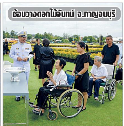
ซ้อมวางดอกไม้จันทน์ จ.กาญจนบุรี