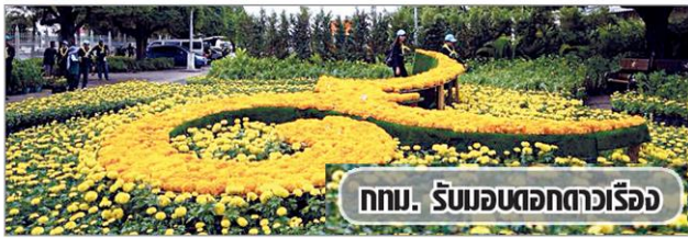
ททท. รับมณฑกดาวเรือง