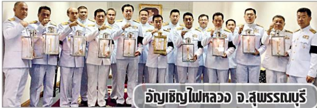
อัญเชิญไฟหลวง จ.สุพรรณบุรี