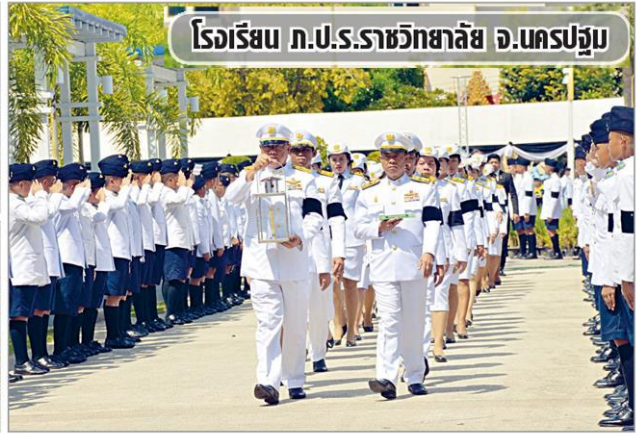
โรงเรียน ภ.ป.ร.ราชวิทยาลัย จ.นครปฐม