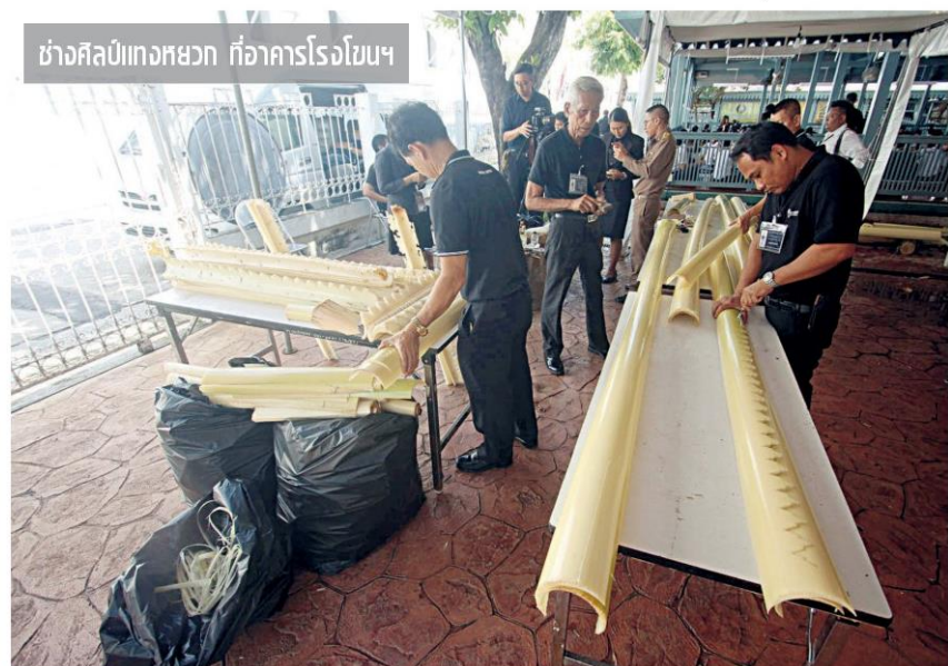
ช่างศิลป์ทวงหขวก ที่อาคารโรงโขนฯ