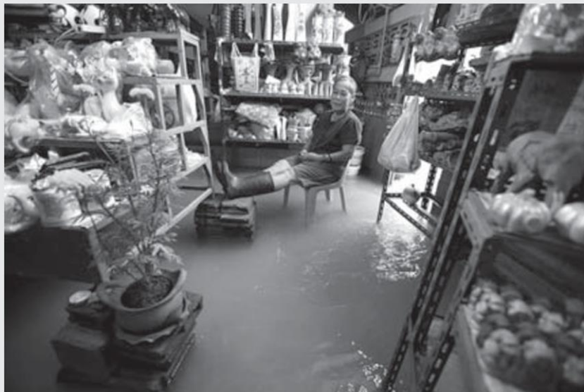
น้ำท่วม - เจ้าของร้านขายของที่ระลึกแห่งหนึ่งในเกาะเกร็ด ได้นำเฟอร์นิเจอร์ที่ถูกน้ำจากแม่น้ำเจ้าพระยาเอ่อเข้าท่วม โดยพบว่าระดับน้ำสูงขึ้นเฉลี่ย 30-60 ซม. และคาดว่า ระดับน้ำจะเพิ่มสูงขึ้นกว่านี้ หลังจากที่กรมชลประทานได้เพิ่มการระบายน้ำจากเขื่อนเจ้าพระยา