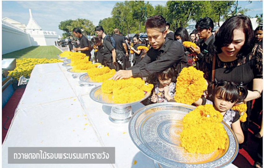
ถวายดอกไม้รอบพระบรมมหาราชวัง

นอกจากนี้ในวันที่ 26 ต.ค. เวลา 07.30-24.00 น. ทดม. เตรียมการอำนวยความสะดวกประชาชนกรณีพื้นที่ที่จอดสนามบินนางเล็งโดยจัดรถรับ-ส่งบริการประชาชนร่วมถวายดอกไม้จันทน์เส้นทาง ทดม.-พระเมรุมาศจำลองสนามบินที่ปากองทัพอากาศ (รูปะเดมิย์) โดยรถจะออกทุก ๆ 20 นาที สำหรับบริการลานจอดรถยนต์นั้น ตั้งแต่วันที่ 23-31 ต.ค. ทดม.ได้จัดพื้นที่จอดรถยนต์โดยไม่คิดค่าบริการบริเวณลานจอดรถยนต์หน้าอาคารจอดรถยนต์ 5 ชั้น ภายในอาคารจอดรถยนต์ 5 ชั้น (เฉพาะชั้น 2 และ 3) ลานจอดรถยนต์ระหว่าง