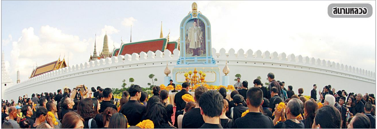
สนามหลวง