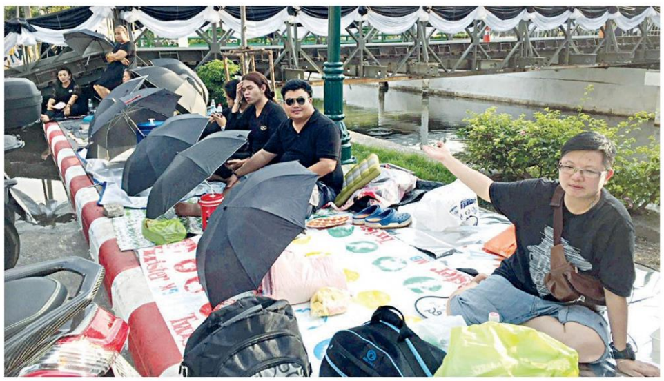
▲ ทயอยจองที่... ชาวกรุงเทพฯ และต่างจังหวัดทยอยจับจองที่มุ่งรอเข้าจุดคัดกรองพระแม่ธรณีบีบมวยผม ริมคลองหลอด เพื่อร่วมพระราชพิธีถวายพระเพลิงพระบรมศพด้วยความสำคัญในพระมหากรุณาธิคุณ

พล.ต.อ.เดชนรงค์ กล่าวต่อว่า สำหรับเส้นทางจราจรนั้นไม่มีปัญหาแต่อย่างไร เพราะมีการปิดการจราจรประชาชนจะเดินเท้ามายังจุดคัดกรองบริเวณพระราชพิธีทั้ง 9 จุด คาดว่าจุดที่คานยิมที่สุดคือจุดคัดกรองพระแม่ธรณีบีบมวยผมนอกจากนี้ยังมีเส้นทางทางเรือเพื่อให้ประชาชนเข้ามาพื้นที่ให้มากที่สุดโดยมี