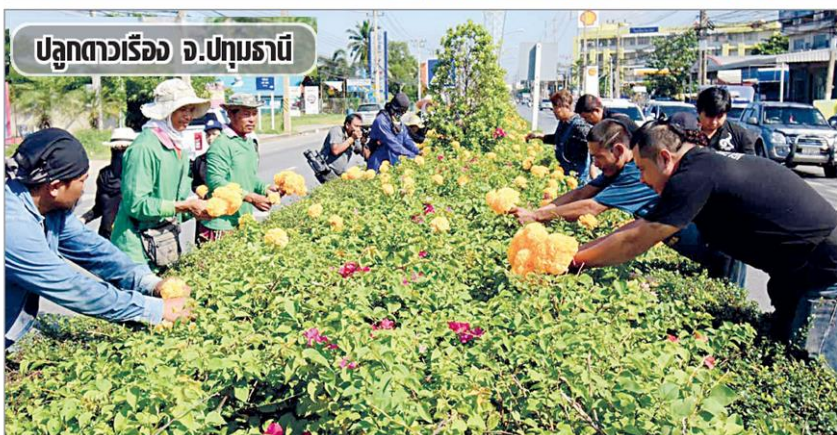
ปลูกดาวเรือง จ.ปทุมธานี