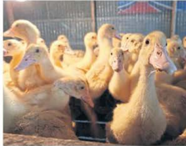
ON THE BILL: Ducks at a farm in Amnat Charoen's Senangkhanikhom district. Some farmers in the northeastern province grow organic jasmine rice for the high-end market.

non-native species, has spread around the country under government promotion. According to an Onep report, the new biomass power plant in Nam Plik will use eucalyptus as supplement fuel along with bagasse.