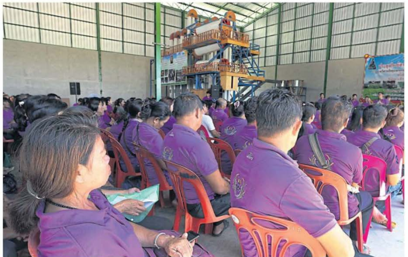
READY TO ROLL: New milling equipment stands in the corner of a rice mill as the Network of Community Enterprise on Organic Farming Amnat Charoen holds a meeting.

>> provide complete information about the pros and cons of the project.