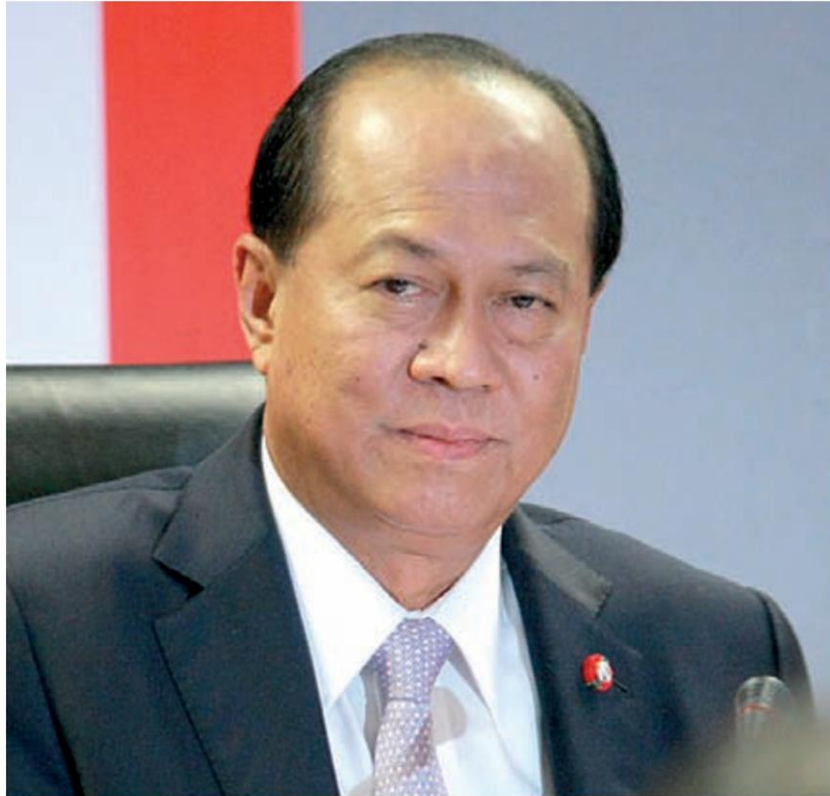
พล.อ.อนุพงษ์ เผ่าจินดา

รวมถึงการได้ผ่อนปรนแรงกระแทก ที่ถ้าโถมเข้ามาทุกทิศทาง และหลังจากนี้ คงต้องมีรายการอื่นตามมาอีกแน่ๆ