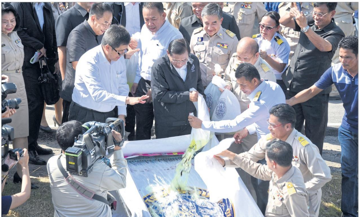
ติดตามงาน : พล.อ.ฉัตรชัย สาริกัลยะ รวบรวม.เกษตรและสหกรณ์ ลงพื้นที่ติดตามการขับเคลื่อนนโยบายการบริหารจัดการน้ำ การผลิตและพัฒนาพันธุ์ข้าวในพื้นที่ และพบปะพูดคุยกับเกษตรกรในพื้นที่ และปล่อยพันธุ์ปลาจำนวน 1 แสนตัว ณ ประตูล่องเรือหน้าบางโฉมศรี จ.สิงห์บุรี