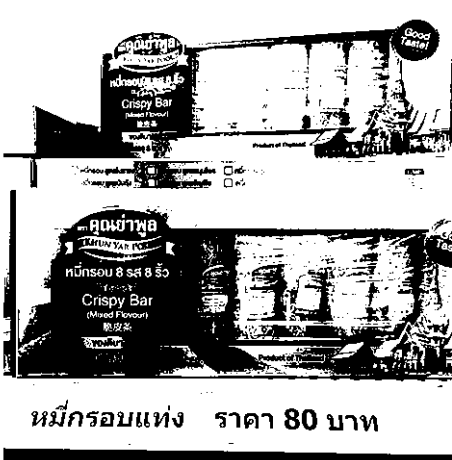
หมักรอบแห้ง ราคา 80 บาท