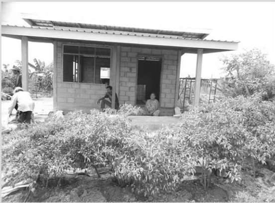
บ้านใหม่ของชาวระบำ