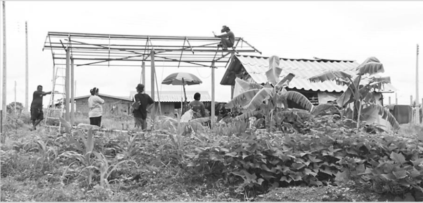
ช่วยกันสร้างบ้านไม่ต้องเสียเงินจ้างช่าง