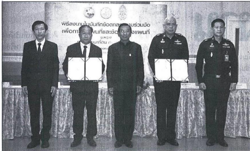
ร่วมมือ : พล.อ.ฉัตรชัย สาริกัลยะ รัฐมนตรีว่าการกระทรวงเกษตรและสหกรณ์ เป็นประธานพิธีลงนามบันทึกข้อตกลงความร่วมมือเพื่อการใช้แผนที่และข้อมูลทางแผนที่ในการใช้ประโยชน์ร่วมกันระหว่างกรมพัฒนาที่ดิน กับกองทัพอากาศ โดยมีนายสุรเดช เดียวตระกูล อธิบดีกรมพัฒนาที่ดิน และพล.อ.สสิน ทองภักดี เสนาธิการทหารบก ร่วมลงนามในพิธี ณ ห้องประชุม กระทรวงเกษตรและสหกรณ์