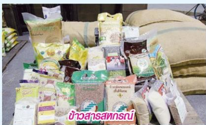
ข้าวสารสหกรณ์

ตลอดเวลาที่ผ่านมา รัฐบาลและภาคส่วนต่าง ๆ ให้ความสำคัญกับการพัฒนาสหกรณ์ เพื่อเป็นเครื่องมือในการสร้างความเข้มแข็งให้กับชุมชนและยกระดับคุณภาพชีวิตของคนในสังคม โดยมีการพูดถึงกันเนืองนิตย์ ทำให้สังคมได้รับรู้ข้อมูลของสหกรณ์เพิ่มมากขึ้น