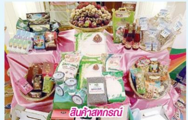
สินค้าสหกรณ์