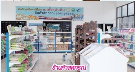
ร้านค้าสหกรณ์