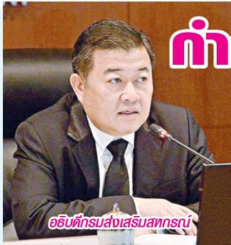
อธิบดีกรมส่งเสริมสหกรณ์

ดังนั้น การกำกับดูแลสหกรณ์ต้องทำด้วยความรอบคอบ และยึดกฎระเบียบความถูกต้องเป็นสิ่งสำคัญ รวมถึงต้องใช้องค์ความรู้ในหลาย ๆ ด้านมาปรับใช้ในการพัฒนาและส่งเสริมสหกรณ์ให้บริหารจัดการได้อย่างมีประสิทธิภาพ พร้อมทั้งนั้นยังได้เห็นนโยบายกับเจ้าหน้าที่ส่งเสริมสหกรณ์ที่จะลงพื้นที่ไปตรวจเยี่ยมแนะนำสหกรณ์ต่าง ๆ ถึงการเข้าร่วมประชุมกับคณะกรรมการของสหกรณ์ในแต่ละครั้ง ควรแสดงบทบาทให้ชัดเจน ในการเสนอความเห็นและแนะนำการดำเนินงานของสหกรณ์