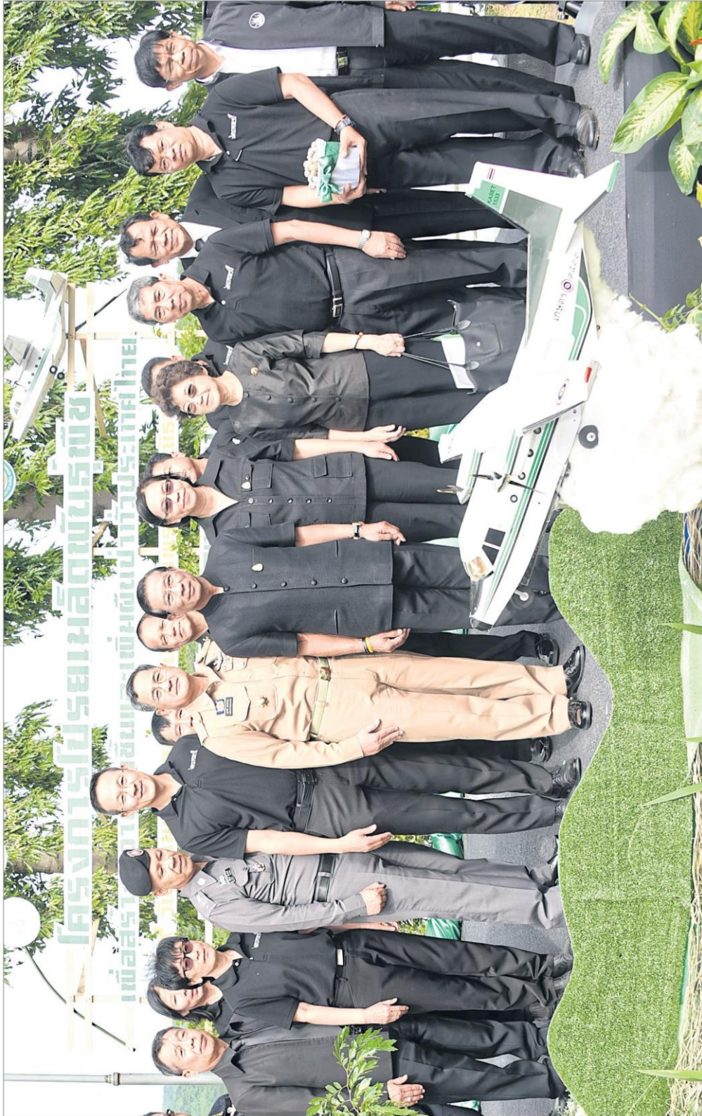
สร้างต้นน้ำ : พล.อ.ฉัตรชัย สาริกัลยะ รัฐมนตรีและสทกรร. เป็นประธานพิธีเปิดโครงการประมงน้ำจืดเพื่อประชาชนและเพิ่มพื้นที่น้ำทั่วประเทศไทย สาธิตต่อพระราชินีและพระบาทสมเด็จพระปรมินทรมหาภูมิพลอดุลยเดช และเฉลิมพระเกียรติสมเด็จพระเจ้าอยู่หัวมหาวชิราลงกรณ บดินทรเทพยวรางกูร ณ เขื่อนลำตะคอง อ.สีคิ้ว จ.นครราชสีมา ซึ่งกรมประมงและการบินเกษตร ร่วมกับอีก 7 หน่วยงานปลูกใน 4 อุทยานแห่งชาติ