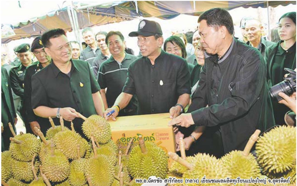
พล.อ.ฉัตรชัย สาริกัลยะ (กลาง) เยี่ยมชมผลผลิตทุเรียนแปลงใหญ่ จ.จตุรดิตถ์