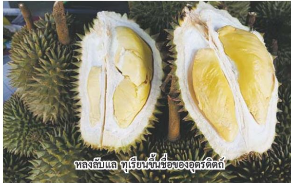
หลังลับแล ทุเรียนขึ้นชื่อของอุดรธานี

เนื่องจากกระทรวงเกษตรฯ ได้ส่งเสริมให้ระบบสหกรณ์มีบทบาทสำคัญในการขับเคลื่อนนโยบายการส่งเสริมการเกษตรแปลงใหญ่ตลอดห่วงโซ่ ตั้งแต่พัฒนาด้านการผลิต การแปรรูป และการตลาด โดยระบบการผลิตจะต้องวางแผนการทำเกษตรให้เหมาะสม โดยใช้ องค์กร-แม่ทัพ โชนนิง, พัฒนาแหล่งน้ำ โดยสนับสนุนเงินกู้ปลอดดอกเบี้ยในการขุด