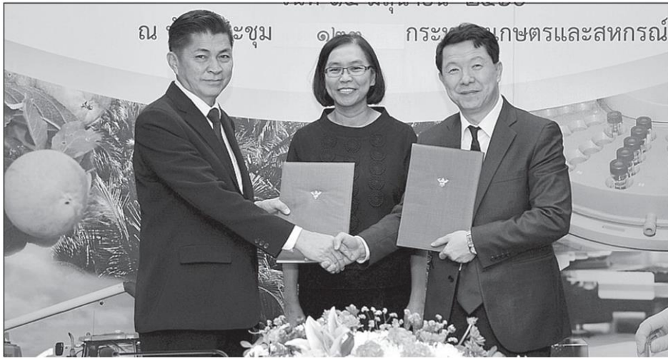
ทุนวิจัย : ชุตินา บุญยประภัศร รมช.เกษตรและสหกรณ์ เป็นประธานพิธีลงนามบันทึกข้อตกลงความร่วมมือโครงการร่วมให้ทุนพัฒนาบุคลากรระดับปริญญาเอก ระหว่างกรมวิชาการเกษตร และสำนักงานกองทุนสนับสนุนการวิจัย (สกว.) ในการดำเนินการ “โครงการร่วมให้ทุนพัฒนาบุคลากรระดับปริญญาเอก” ที่กระทรวงเกษตรฯ เมื่อเร็ว ๆ นี้.