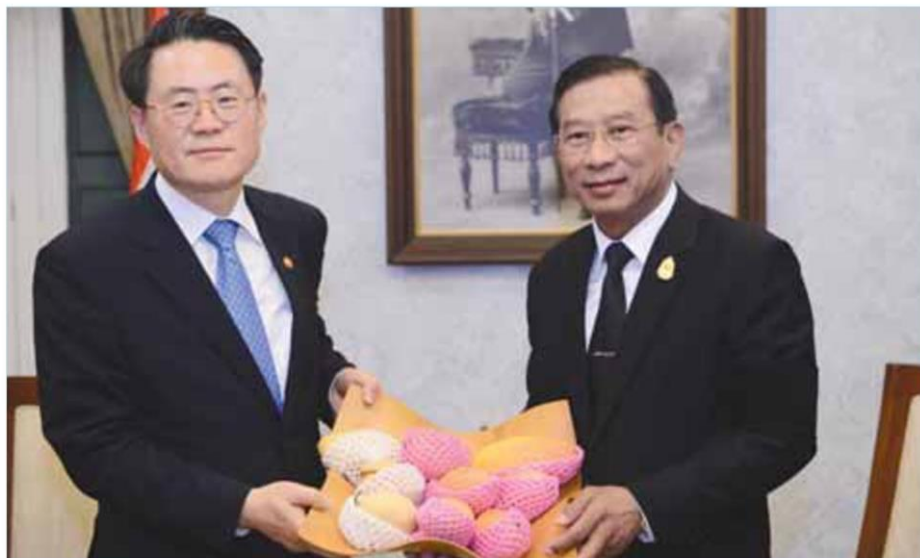
ทหารเรือเปิดตลาด..พลเอก ฉัตรชัย สาริกัลยะ รัฐมนตรีว่าการกระทรวงเกษตรและสหกรณ์ ทหารเรือร่วมกับ นายคิม แจ ซู (H.E.Kim Jae-Soo) รัฐมนตรีว่าการกระทรวงเกษตร อาหาร และกิจการชนบทสาธารณรัฐเกาหลี ในประเด็นการเร่งรัดการพิจารณาเปิดตลาดนำเข้า มะม่วงพันธุ์มหาชนกของไทย ณ ห้องรับรอง กระทรวงเกษตรและสหกรณ์