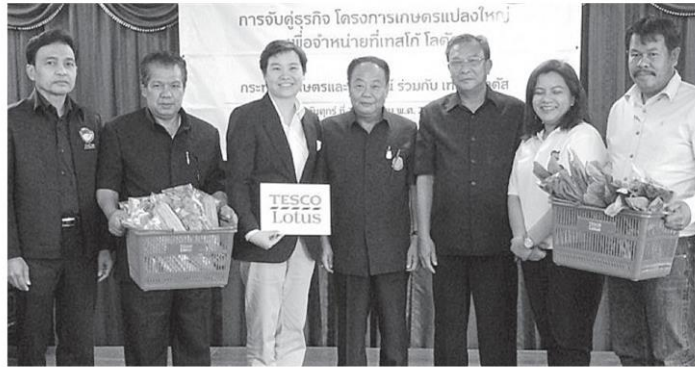
เจรจาทูร์กิจ นำชัย พรหมมีชัย รองปลัดกระทรวงเกษตรและสหกรณ์ เป็นประธานในงาน “จับคู่เจรจาทูร์กิจโครงการเกษตรแปลงใหญ่” ที่เทสโก้ โลตัส ร่วมกับกระทรวงเกษตรฯ เพื่อสนับสนุนการรับซื้อสินค้าโดยตรงจากเกษตรกรแปลงใหญ่ ที่ห้องประชุมศูนย์ส่งเสริมและพัฒนาอาชีพการเกษตร จ.ปทุมธานี