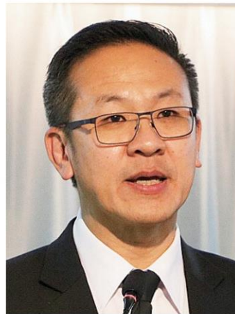
สุรสีห์ กิตติมณฑล

เป้าหมายปี 2560 กรมมีศูนย์ปฏิบัติการฝนหลวง 5 แห่ง ป้องกันและบรรเทาปัญหาภัยแล้งได้ 72.5% ของพื้นที่ภัยแล้ง ป้องกันและบรรเทาปัญหาภัยพิบัติได้ 35% ของพื้นที่ภัยพิบัติ ใช้งบประมาณ 2,223 ล้านบาท ในปี 2560-2564 จะมีศูนย์ปฏิบัติการฝนหลวงเป็น 7 แห่ง จะสามารถป้องกันและบรรเทาปัญหาภัยแล้งได้ 90% ของพื้นที่ภัยแล้ง ป้องกันและบรรเทาปัญหาภัยพิบัติได้ 50% ของพื้นที่ภัยพิบัติ มีศูนย์กลางถ่ายทอดด้านการตัดแปรสภาพอากาศ มีศูนย์การบินตัดแปรสภาพอากาศ ประกาศใช้มาตรฐานด้านการบิน มี Smart Officer 100% และมีโครงสร้าง