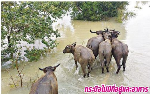
กระบือไม่มีที่อยู่และอาหาร

อย่างไรก็ตามจากการสำรวจเบื้องต้นพบผู้ประสบภัยส่วนใหญ่มีความต้องการถุงยังชีพ ซึ่งกรมส่งเสริมสหกรณ์ได้ประสานกับสำนักงานสหกรณ์จังหวัดทุกจังหวัดให้ระดมความช่วยเหลือจากขบวนการสหกรณ์ในจังหวัดต่าง ๆ ทั่วประเทศ เพื่อร่วมกันบริจาคเงินสมทบทุนช่วยเหลือสมาชิกสหกรณ์ในจังหวัดภาคใต้ โดยสามารถโอนเงินเข้าบัญชีธนาคารกรุงไทย จำกัด สาขาเทเวศร์ ชื่อบัญชี เงินช่วยเหลือผู้ประสบภัย กรมส่งเสริมสหกรณ์ เลขบัญชี 070-0-03233-9 ขณะนี้มียอดบริจาคจากขบวนการสหกรณ์ในภาคต่าง ๆ ททยอยเข้ามา