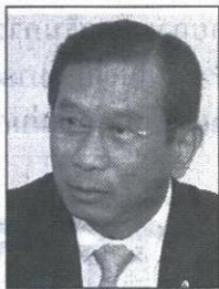
พล.อ.ฉัตรชัย สาริกัลยะ

ปัจจุบันกรมชลประทานมีเครื่องสูบน้ำอยู่ในพื้นที่ภาคใต้ที่ถูกน้ำท่วม 105 เครื่อง และยังมีสำรองเพิ่มเติมอีก 134 เครื่อง จากทั้งหมดรวม 627 เครื่อง ปัจจุบันสถานการณ์น้ำท่วมภาคใต้ 9 จังหวัด ซึ่งผลกระทบด้านภาคการเกษตรในเบื้องต้น พื้นที่การเกษตรที่คาดว่าจะได้เสียหายประมาณ 980,000 ไร่ เกษตรกรได้รับความเสียหาย 391,500 ราย แบ่งเป็น ข้าว 250,000 ไร่ พืชไร่ 21,000 ไร่ พืชสวนและอื่นๆ 709,000 ไร่ โดยในส่วนนี้เป็นยางพาราประมาณ 531,876 ไร่ คิดเป็น 4.6% ของพื้นที่ปลูกยางทั่วประเทศ ซึ่งจากข้อมูลทางวิชาการ