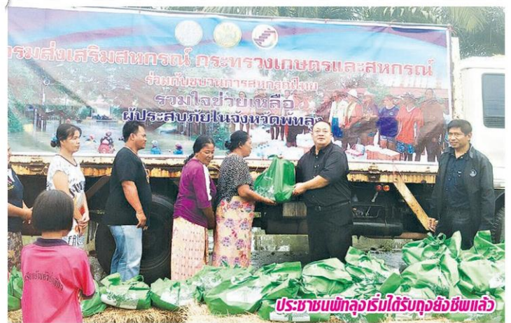
ประชาชนพัทลุงเริ่มได้รับถุงยังชีพแล้ว

ซึ่งทางกรมฯจะนำไปจัดซื้อของใช้ที่จำเป็นและจัดทำถุงยังชีพ ที่ภายในประกอบด้วย ข้าวสาร ปลากระป๋อง น้ำปลา ยาสีฟัน และสบู่ จำนวน 10,000 ถุง เพื่อจัดส่งไปให้กับสมาชิกสหกรณ์และประชาชนในภาคใต้ โดยได้เริ่มแจกจ่ายไปบ้างแล้วที่จังหวัดพัทลุงและจะทยอยแจกให้ถึง