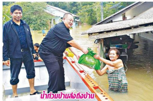
น้ำท่วมบ้านล่องถึงบ้าน

มือผู้ประสบภัยทั้ง 10 จังหวัดอย่างต่อเนื่องต่อไป