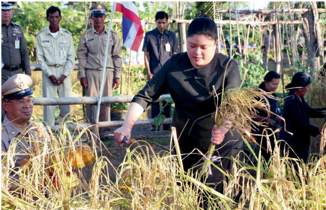
พระเจ้าหลานเธอ พระองค์เจ้าอทิตยาทรกิติคุณ ทรงเกี่ยวข้าวในแปลงผลิตเมล็ดพันธุ์ข้าวหอมมะลิ 105 ภายในศูนย์เรียนรู้การเกษตรส่วนพระองค์ บ้านระไซร์ ต.ตั้งใจ อ.เมือง จ.สุรินทร์ เมื่อวันที่ 16 พฤศจิกายน

'พระองค์ดี'เสด็จ ทรงเกี่ยวข้าวสุรินทร์ นายเกษม'บักฉัตร' แก้ปมราคา'พืชผล' พระองค์ดีทรงเกี่ยวข้าว แปลงนาศูนย์เรียนรู้การเกษตร ส่วนพระองค์ (อ่านต่อหน้า 9)