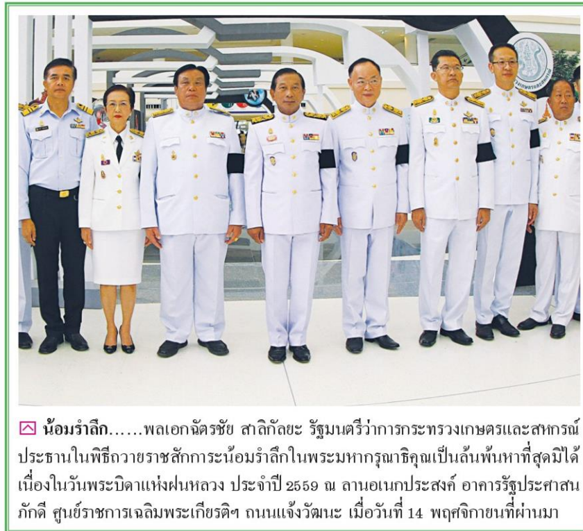
☒ น้อมรำลึก.....พลเอกฉัตรชัย สาริกัลยะ รัฐมนตรีว่าการกระทรวงเกษตรและสหกรณ์ ประธานในพิธีถวายราชสักการะน้อมรำลึกในพระมหากรุณาธิคุณเป็นล้นพ้นหาที่สุดมิได้ เนื่องในวันพระบิดาแห่งฝนหลวง ประจำปี 2559 ณ ลานอเนกประสงค์ อาคารรัฐประศาสน ภักดี ศูนย์ราชการเฉลิมพระเกียรติฯ ถนนแจ้งวัฒนะ เมื่อวันที่ 14 พฤศจิกายนที่ผ่านมา