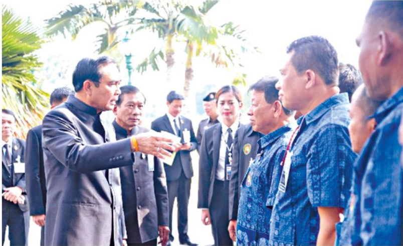
ให้กำลังใจ- นายสุเทพ คงมาก นายกษมาคมชานาและเกษตรกรไทย พร้อมด้วยตัวแทนเข้าพบนายกรัฐมนตรี เพื่อให้กำลังใจ ในการแก้ไขปัญหาการขาดน้ำ ทำเนียบรัฐบาล

"ประยุทธ์" แจง ตรวจเยี่ยมทุกกระทรวง หวังให้งานเดินหน้าตามยุทธศาสตร์ชาติ บอกไม่ต้องจัดต้อนรับ เผยลงพื้นที่ "ปทุมธานี" วันศุกรนี้ ตรวจสถานการณ์น้ำ