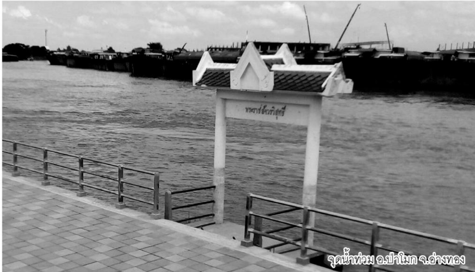
จุดน้ำท่วม อ.ป่าโมก จ.อ่างทอง