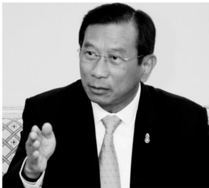
พล.อ. จิตร์ชัย สาริกัลยะ รมว.เกษตรและสหกรณ์