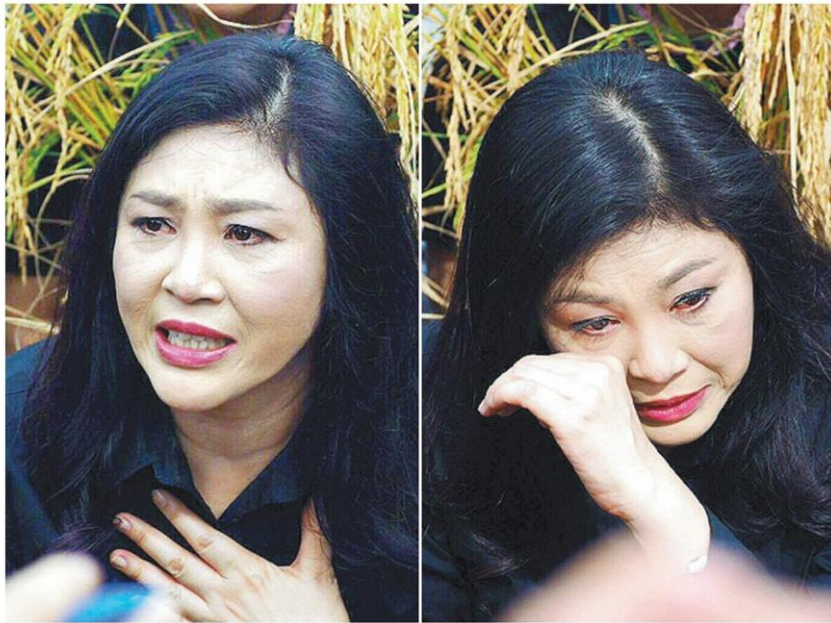
จำเริญ - น.ส.ยิ่งลักษณ์ ชินวัตร อดีตนายกรัฐมนตรี จำเริญหว่างแวนะซื้อข้าวที่ชาวนานำมาวางขาย และให้สัมภาษณ์สื่อมวลชน ที่ จ.อุบลราชธานี เมื่อวันที่ 3 พฤศจิกายน