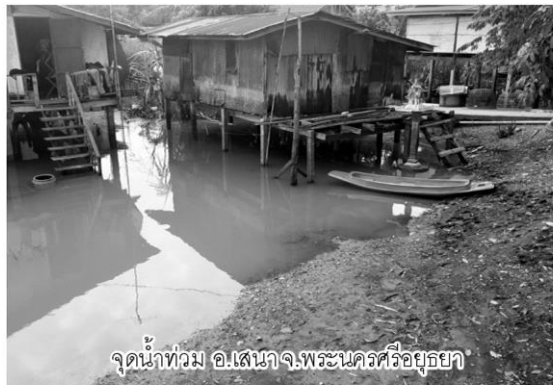
จุดน้ำท่วม อ.เสนา จ.พระนครศรีอยุธยา

พลันที่มีรับสั่งจากสมเด็จพระบรมโอรสาธิราชเจ้าฟ้ามหาวชิราลงกรณสยามมกุฎราชกุมารกังวลในเรื่องอุทกภัยที่ประชาชนกำลังประสบอยู่ มาถึงกระทรวงเกษตรและสหกรณ์