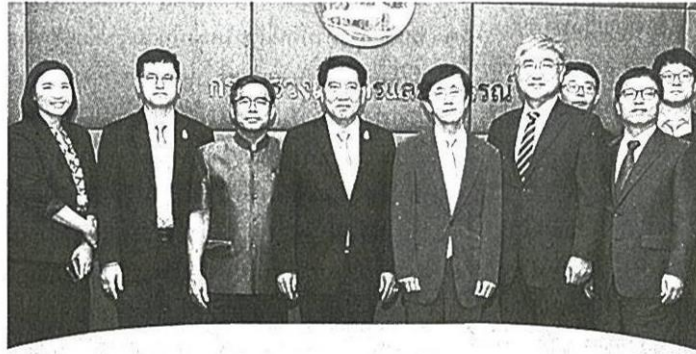
ประชุมหารือ เลิศวิโรจน์ โกวัฒนะ รองปลัดกระทรวงเกษตรและสหกรณ์ พร้อมด้วย สมเกียรติ ประจำวงษ์ รองอธิบดีกรมชลประทาน ประชุมหารือกับ กิม กยอง ฮวัน ผช.รมต.กระทรวงที่ดิน โครงสร้างพื้นฐานและการขนส่ง สาธารณรัฐเกาหลี ร่วมมือโครงการพัฒนาลุ่มน้ำห้วยหลวงตอนล่าง.