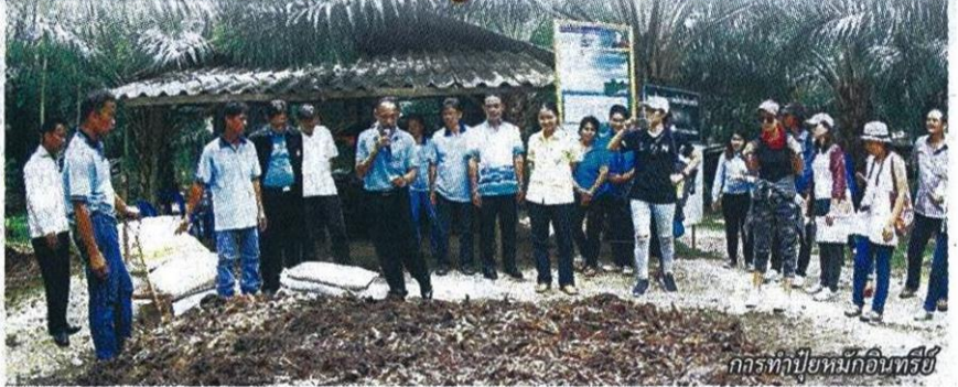
การทำปุ๋ยหมักอินทรีย์

จะถ่ายทอดให้แก่เกษตรกร ซึ่งที่ศูนย์บริการพัฒนาปลวกแดงตามแนวพระราชดำริ จ.ระยอง ถือเป็นศูนย์กลางอีกแห่งหนึ่ง บริการฝึกอาชีพและแลกเปลี่ยนเรียนรู้ และเป็นแหล่งท่องเที่ยวด้านเกษตรในพระราชดำริที่เป็นเส้นทางความรู้ด้านเศรษฐกิจพอเพียงในพื้นที่ชุมชนรอบข้าง ที่ส่วนใหญ่มีอาชีพทำสวนผลไม้และยางพารา ซึ่งต้องเผชิญกับราคาผลผลิตที่ไม่แน่นอนทำให้เกษตรกรหลายรายขาดทุนและต้องจมอยู่กับหนี้ ปรัชญาเศรษฐกิจพอเพียง จึงถือเป็นทางออกให้เกษตรกรอย่างยั่งยืน