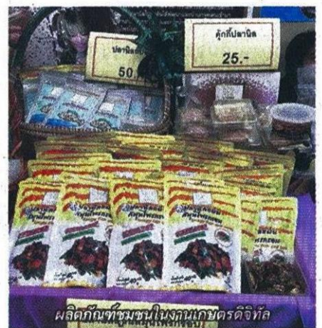
ผลิตภัณฑ์ชุมชนใน gianเกษตรดิจิทัล

เสริม สร้างโอกาส เพิ่มช่องทางการตลาด รายได้ ตลอดจนความรู้ให้แก่เกษตรกร ผู้ประกอบการ เพื่อสร้างแรงบันดาลใจต่อผู้ประกอบการด้านเอสเอ็มอี และกลุ่มผู้ประกอบการธุรกิจเกิด