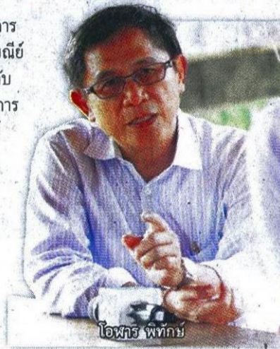
ไอฟาร์ พัทย์

สนับสนุนการค้าออนไลน์ การขนส่งสินค้าผ่านระบบไปรษณีย์ การตรวจสอบสินค้าย้อนกลับของผลิตภัณฑ์การเกษตร การสร้างชุมชนให้เรียนรู้ศาสตร์ต่างๆ เกิดการผลิตสินค้า บริการผ่านระบบดิจิทัล เป็นต้น ตามนโยบายขับเคลื่อนเศรษฐกิจและสังคมดิจิทัล (ดิจิทัลอีโคโนมี) และตามวิสัยทัศน์ของกระทรวงเกษตรฯ ที่ต้องการส่งเสริม