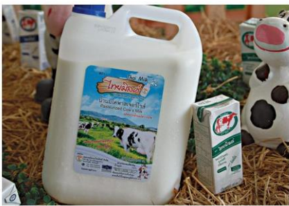
ผลิตกันทัน

คือ 1. การปรับปรุงโครงการฟาร์มโคนมของเกษตรกร มีการติดตั้งระบบรีดนม และระบบถังเก็บนมพร้อมเครื่องทำความสะอาด เพื่อพัฒนาคุณภาพการผลิตน้ำนมโคตามมาตรฐานฟาร์มโคนม (GAP) 2. การจัดตั้งศูนย์ผลิตอาหารโคนม และการทำแปลงหญ้าขนาดใหญ่ โดยสหกรณ์ผลิตอาหาร TMR (Total Mix Ration) และจัดส่งถึงฟาร์มของเกษตรกรโดยตรง เป็นการเพิ่มปริมาณและคุณภาพการผลิตน้ำนมโค และลดต้นทุนการผลิต 3. การจัดฟาร์มโค