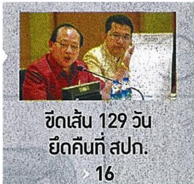
ขุดเส้น 129 วัน ยึดคืนที่ สปก. > 16