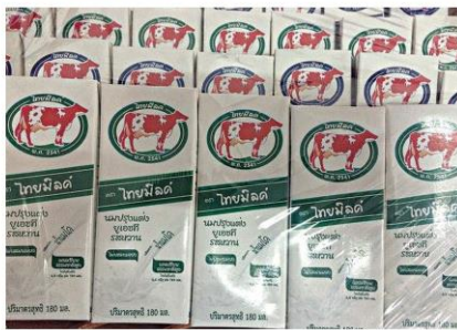
นมกล่องที่ผลิต