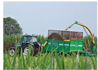
ปลูกและเก็บเกี่ยวอาหารสัตว์

โดยสนับสนุนและสร้างความเข้มแข็งให้กับเกษตรกร ผู้เลี้ยงโคนมและสหกรณ์ให้สามารถดำเนินธุรกิจโคนมอย่างยั่งยืน โดยการปรับโครงสร้างการผลิตสินค้าเกษตร และการลดต้นทุนการผลิต จึงได้ดำเนิน “โครงการเพิ่มประสิทธิภาพและผลผลิตน้ำนมโคครบ