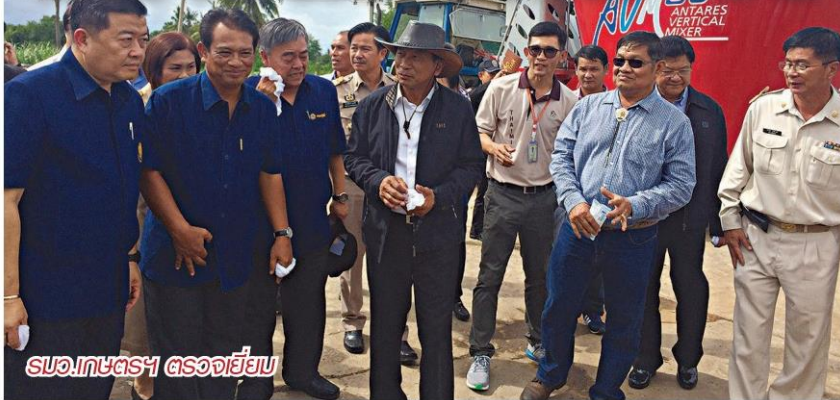
รมว.เกษตรฯ ตรวจสอบ

สนับสนุนจากกระทรวงมหาดไทย และจังหวัดสระบุรีด้วย ซึ่งสหกรณ์โคนมไทยมิลค์ จำกัด เป็น 1 ใน 3 สหกรณ์ต้นแบบที่เข้าร่วมโครงการดังกล่าวนี้และมีผลสัมฤทธิ์จากการดำเนินงานตามเป้าหมายการปรับโครงสร้างการผลิตและลดต้นทุนการผลิตน้ำนมโคของเกษตรกร