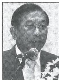
พล.อ.ฉัตรชัย สาริกัลยะ

พล.อ.ฉัตรชัย กล่าวอีกว่า สหกรณ์โคนมไทยมิลค์ ได้ดำเนินการตามแนวทางเกษตรแปลงใหญ่ด้านปศุสัตว์ โดยเกษตรกรร่วมกันบริหารจัดการการผลิตแปลงหญ้าขนาดกว่า 1,200 ไร่ พร้อมนำเทคโนโลยีเครื่องจักรกลมาใช้ เพื่อลดต้นทุนการผลิต แก้ไขปัญหาการขาดแคลนแรงงาน เพิ่มคุณภาพการผลิตอาหารสัตว์แก่โคนม เพิ่มปริมาณผลผลิตน้ำนมโค ทำให้สามารถผลิตน้ำนมจากเดิม 125 ตันต่อวัน เป็น 140 ตันต่อวัน ทำให้มีรายได้เพิ่มจากการขายน้ำนมดิบกว่า 100 ล้านบาทต่อปี นอกจากนี้ ยัง