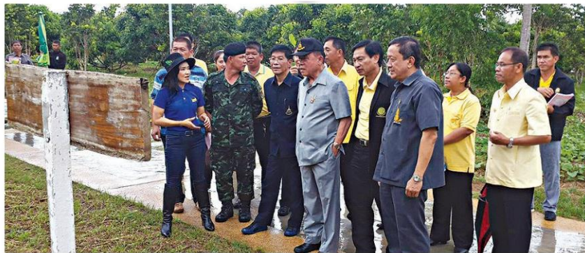
คณะให้ความสนใจการบริหารจัดการพื้นที่

สำเร็จพร้อมขยายผลสู่กลุ่มเกษตรกรได้อีกด้วย และนอกจากงานพัฒนาไม้ผลคุณภาพ ปลอดภัย ยังได้มีการจัดทำแปลงทฤษฎีใหม่ ในพื้นที่กว่า 6 ไร่ พร้อมจัดทำจุดเรียนรู้ มีการ สาธิตการเพาะเลี้ยงสัตว์น้ำ การเลี้ยงสุกร การ ทำน้ำหมักชีวภาพ เพื่อเป็นแหล่งเรียนรู้ของ เกษตรกร ในรูปแบบเกษตรอินทรีย์ ภายใต้ หลักปรัชญาของเศรษฐกิจพอเพียง ในการ สร้างภูมิคุ้มกันในการทำการเพาะปลูกแบบไม่ พึ่งพิงวัตถุเคมีการเกษตรสำหรับการ บำรุงต้นพืชจากภายนอก ให้กับเกษตรกรไทย ในอนาคต.