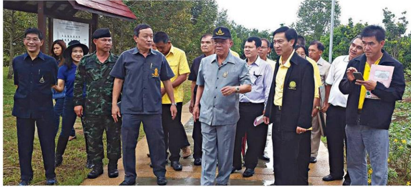
รองปลัดกระทรวงเกษตรฯ ให้การต้อนรับ