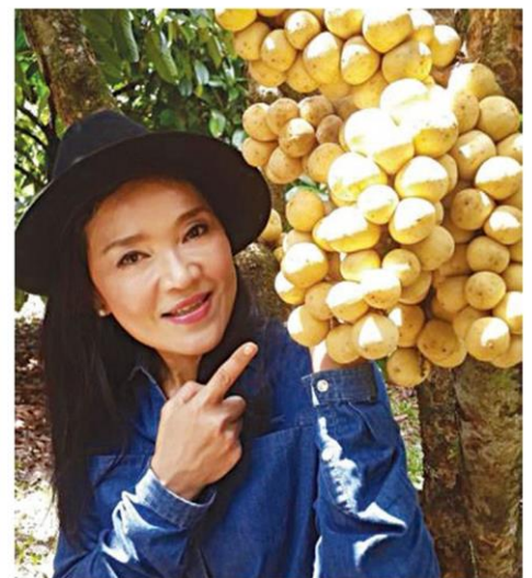
ลองกองพลลิตดีสมบูรณ์

ที่สำคัญภายในศูนย์ฯ ได้ดำเนินการสนองพระราชดำริพระบาทสมเด็จพระเจ้าอยู่หัว เพื่อศึกษาวิจัย รวบรวมพันธุ์ทุเรียนท้องถิ่น และพัฒนาพันธุ์ทุเรียนใหม่ที่ปัจจุบันประสบความสำเร็จ