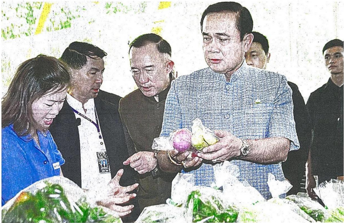
▲ แอ้วเชียงใหม่ พล.อ.ประยุทธ์ จันทร์โอชา นายกษและหัวหน้า คสช. เดินชมผักและผลไม้ของศูนย์ผลิตผลโครงการหลวงแม่เหิยะ ในโอกาสลงพื้นที่เป็นประธานการประชุมคณะกรรมการประสานงานและสนับสนุนงานโครงการหลวง จ.เชียงใหม่.

ไปโพสต์ในโซเชียลมีเดีย ทราบเพียงว่าเข้าข่ายกระทำความผิดตาม พ.ร.บ.ว่าด้วยการกระทำความผิดเกี่ยวกับคอมพิวเตอร์ แต่ยังไม่พบข้อมูลว่าข้อความเหล่านั้นขัดต่อ พ.ร.บ.ว่าด้วยการออกเสียงประชามติร่างรัฐธรรมนูญ