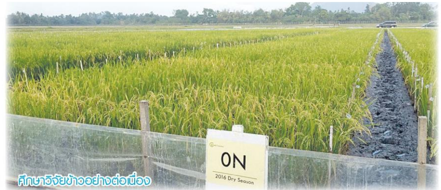
ศึกษาวิจัยข้าวอย่างต่อเนื่อง

“จุดเด่นของการผลิตข้าวในประเทศไทยคือมีองค์ความรู้มากมาย ทั้งทางด้านวิชาการซึ่งหลายหน่วยงานให้ความสนใจพัฒนาองค์ความรู้ด้านข้าวมาอย่างต่อเนื่อง ขณะเดียวกันก็มีองค์ความรู้ที่มาจากปราชญ์ชาวบ้าน อีกประการหนึ่งคือสภาพภูมิประเทศมีความเหมาะสมกับการผลิตข้าวคุณภาพ แต่ด้วยภาวะการแข่งขันสินค้าข้าวมีค่อนข้างสูง ทำให้เราประสบปัญหาขาดทุนการผลิตสูงเนื่องจากค่าแรงขั้นต่ำของเราสูงกว่าประเทศเพื่อนบ้าน จึงต้องปรับเปลี่ยนแข่งขันในด้านคุณภาพการผลิตข้าวโดยมีกรมการข้าวเป็นแม่ข่ายหลักในการดูแลยุทธศาสตร์ข้าวทั้งระบบ