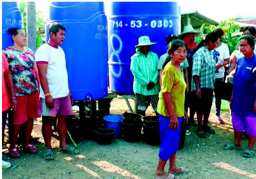
รอคิว - ชาวบ้านหมู่ 2 ต.เขาแก้ว อ.สรรพยา จ.ชียนาท ต่อคิวรับน้ำ จากปัญหาน้ำแห้ง ต้องตั้งจุดแจกจ่ายน้ำกลางหมู่บ้าน ชาวบ้านวอนหน่วยงานราชการเร่งช่วยเหลือให้นำน้ำมาเติมให้ชาวบ้านได้ใช้ เพื่อบรรเทาความเดือดร้อน เมื่อวันที่ 6 มีนาคม

"ถ้าสิ่งที่เราพูดมาเป็นผลดีต่อธุรกิจและต่อประเทศ ก็สามารถเสนอเรื่องเข้ามา เราพร้อมจะผลักดันให้ธุรกิจค้าทองคำและอัญมณี มีความเข้มแข็ง แม้ว่ารัฐบาลจะไม่ได้ช่วยอะไรมากนักก็แข่งขันในตลาดโลกได้ เพราะแรงงานที่มีฝีมืออันดับต้นๆ ของโลก ซึ่งปี 2558 ธุรกิจทองคำและอัญมณีมีมูลค่าการส่งออกถึง 3.7 แสนล้านบาท อยู่อันดับ 3 ของการส่งออกสินค้าทั้งหมด" นายอภิศักดิ์กล่าว และว่า นอกจากนี้ ผাগให้ผู้ประกอบการธุรกิจค้าทองคำร่วมโครงการทำบัญชีเล่มเดียวกับกรมสรรพากร โดยจะไม่ไปตรวจสอบการชำระภาษีย้อนหลัง เพื่อเปิดโอกาสให้ทุกคนชำระแบบถูกต้อง ได้รับรายงานว่ามีผู้ประกอบการเอสเอ็มอีเกือบ 4 แสนราย จาก 4.2 แสนรายเข้าโครงการแล้ว