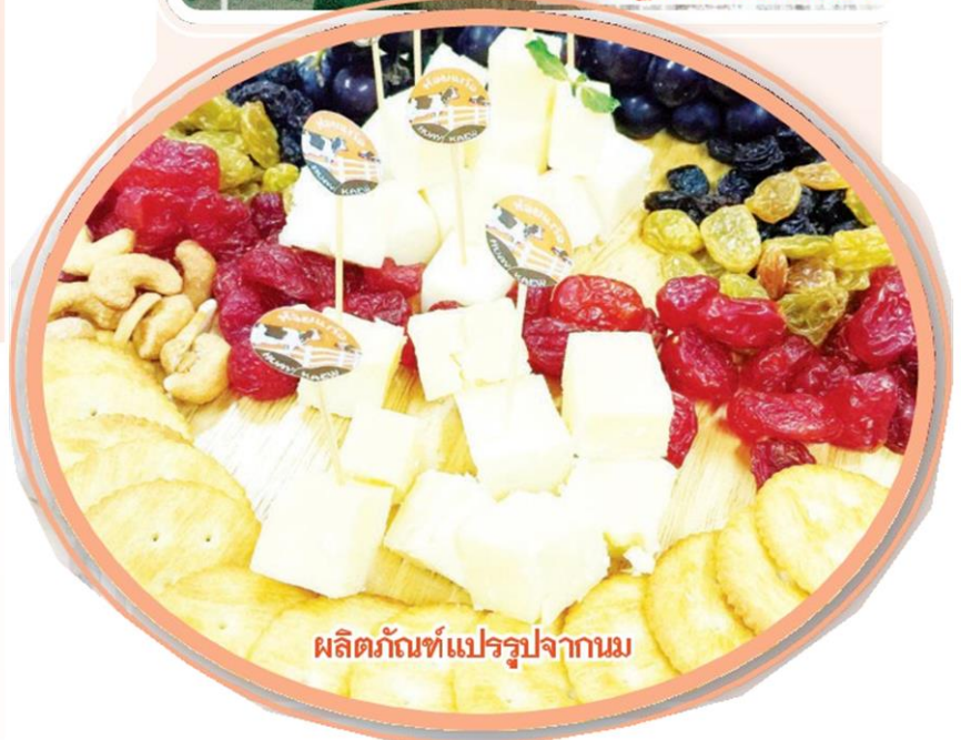
ผลิตภัณฑ์แปรรูปจากนม