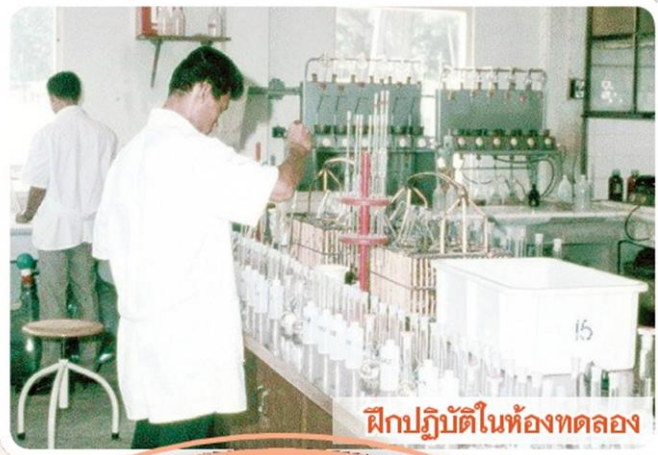
ฝึกปฏิบัติในห้องทดลอง

ตลอดระยะเวลา 12 ปี ตั้งแต่ พ.ศ. 2508-2520 โครงการฯ เน้นการพัฒนากิจการกรม