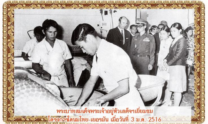
พระบาทสมเด็จพระเจ้าอยู่หัวเสด็จฯ เยี่ยมชม โครงการโคเนมไทย-เยอรมัน เมื่อวันที่ 3 ม.ค. 2516