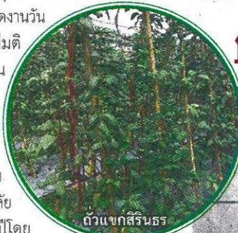
ตัวแขกสิรินธร

มีการแลกเปลี่ยนทางวิชาการและเทคโนโลยีด้าน