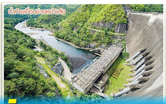
น้ำท้ายเขื่อนช่วงหน้าแล้ง