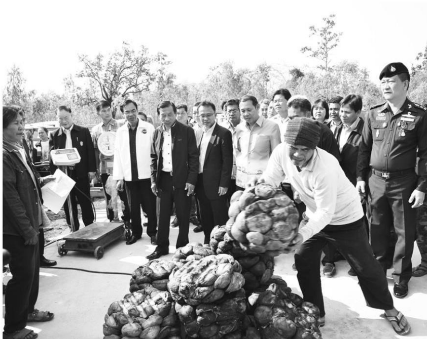
รับซื้ออย่าง...พล.อ.ฉัตรชัย สาริกัลยะ รัฐมนตรีว่าการกระทรวงเกษตรและสหกรณ์ ลงพื้นที่ติดตามการซื้อขายยางพาราตามนโยบายรัฐบาล ณ สหกรณ์กองทุนสวนยางนาแต่ จำกัด ต.นาแต่ อ.เมือง จ.อำนาจเจริญ