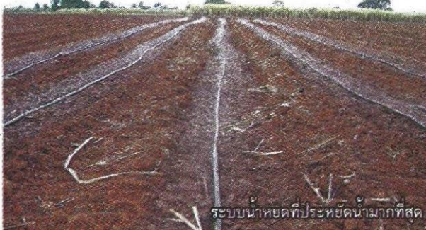
ระบบน้ำหยดที่ประหยัดน้ำมากที่สุด

ของกระทรวงเกษตรและสหกรณ์ ไร่นานอกเขตชลประทาน ทั้ง 352,528 บ่อ มีปริมาตรน้ำ 187.46 ล้าน ลบ.ม. หรือ 53% ของความจุทั้งหมด (ณ 13 ม.ค.59) อ่างเก็บน้ำขนาดเล็กทั่วประเทศอีก 4,789 แห่ง มีปริมาตรน้ำรวม 1,102.01 ล้าน ลบ.ม. หรือ 61% ของความจุทั้งหมด