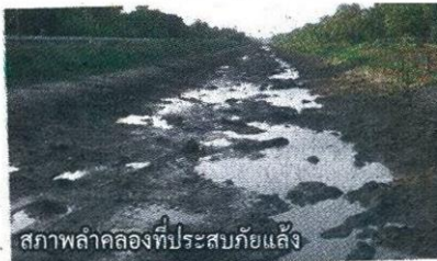
สภาพลำคลองที่ประสบภัยแล้ง

ในฐานะที่มหาวิทยาลัยเกษตรศาสตร์ เป็นสถาบันการศึกษาที่มีการเรียนการสอนที่เน้น